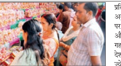
देवी लक्ष्मी और गणेश भगवान की मूर्ति की खरीददारी करता एक परिवार।

प्रति किलो के दाम हैं। एक अनुमान के अनुसार आज धनतेरस पर देश में लगभग 41 टन सोना और तकरोबन 400 टन चांदी के गहने ओर सिक्के की बिक्री हुई। देश में लगभग 4 लाख छोटे बड़े ज्वेलर्स हैं जिनमें 1 लाख 85 हजार जेवेलर्स भारतीय मानक ब्यूरो में रजिस्टर जेवेलर्स है और लगभग 2 लाख 25 छोटे ज्वेलर्स हैं जो उन क्षेत्रों में जहां सरकार ने अभी बीआईएस लागू नहीं किया है। प्रति वर्ष विदेश से लगभग 800 टन सोना तथा लगभग 4 हजार टन चाँदी आयात होती है। सोन्गालिया ने बताया कि आज धनतेरस भर भगवान धन्वतरि का भी प्रदुर्भाव