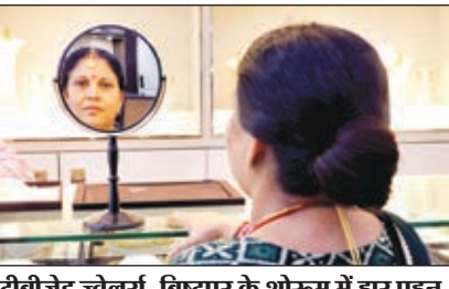
टीबीजेड ज्वेलर्स, विट्टपुर के शोरूम में हर पहन कर आईना देखती एक महिला ग्राहक।