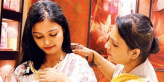
तनिष्क के विट्टपुर शोरूम में हर परसंद करती एक महिला।