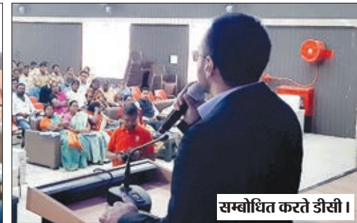
सम्बोधित करते डीसी।