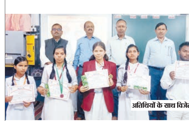
अतिथियों के साथ विजेता।

रोक लगाई जाए। गरीबी, बेरोजगारी और पलायन इस क्षेत्र की पूर्व से ही गम्भीर समस्या है। इसमें और इजाफा करने का काम न किया जाए।