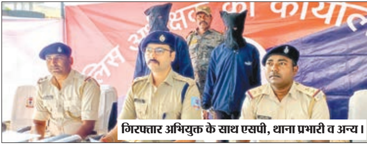
गिरफ्तार अभियुक्त के साथ एएसपी, थाना प्रभारी व अन्य।