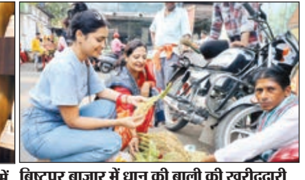
विट्टपुर बाजार में धान की वाली की खरीददारी करतीं मां-बेटी।