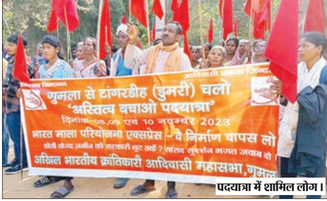
पदयात्रा में शामिल लोग।

गुमला। भारत माला परियोजना के खिलाफ अखिल भारतीय क्रांतिकारी आदिवासी महासभा द्वारा आयोजित तीन दिवसीय अस्तित्व बचाओ पदयात्रा का समापन 85 किलोमीटर की दूरी तय कर सांसद सुदर्शन भगत के गांव डुमरी टांगरडीह में समापन हुआ। समापन के पूर्व प्रधानमंत्री नरेंद्र मोदी तथा सांसद सुदर्शन भगत को सम्बोधित अलग-अलग मांग पत्र प्रतिनियुक्त पदाधिकारी, बीपीओ डुमरी को सौंपा गया। पीएम को संबोधित मांग पत्र में कहा गया है कि हमारी 80 फीसदी जमीन जिसमें आजकाल के लिए धान की फसल होती है। उसमें एक्सप्रेस वे निर्माण