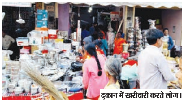
दुकान में खरीदारी करते लोग।