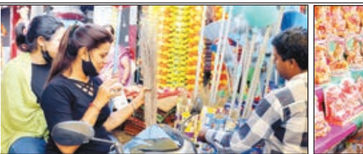
विट्टपुर बाजार में झाड़ू खरीदती स्कूटी सवार एक युवती।