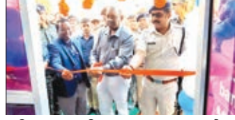
फ़ीता काट एटीएम का शुभारंभ करते आईजी व एसपी।