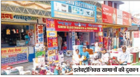
इलेक्ट्रॉनिक सामानों की दुकान।

बरवाडीह। शुकवार को धनतेरस पर बरवाडीह बाजार में जमकर धन बरसा है। सुबह से ही बाजारों में खरीदारी के लिए भिड़ उमड़ी रही। दोपहर बाद तो मैंम बाजार में तिल रखने की जगह नहीं थी। शाम होने से पहले ही बाजार रोशनी से नहा उठा। ऑटोमोबाइल, इलेक्ट्रॉनिक, बर्तन, कपड़े और सराफा बाजार में जमकर कारोबार हुआ है। शाम के समय बाजार में जमकर भीड़ हुई। हर दुकान पर देर रात तक ग्राहकों का मेला लगा रहा। विशेष तौर पर शुभ मुहूर्त में लोगों ने बर्तन, वाहन, कपड़े और इलेक्ट्रॉनिक उत्पाद की खरीदारी की। इससे पहले सुबह से ही बाजार में खरीदारी की रंगत नजर आने लगी थी, जो रात तक परवान पर रही। बाजार सुबह जल्दी ही सज गए और ग्राहकों के आने का सिलसिला शुरू हो गया। हर कोई