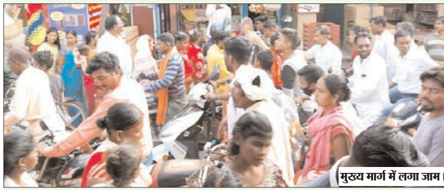
मुख्य मार्ग में लगा जाम।