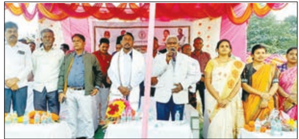
कार्यक्रम को संबोधित करते मंत्री चंपई सोरेन।

गम्हरिया। सूचे के आदिवासी कल्याण सह परिवहन मंत्री चंपई सोरेन ने कहा कि झारखंड में आदिवासी-मूलवासियों की संस्कृति, सभ्यता एवं धार्मिक स्थलों का तेजी से विकास हो रहा है। आदिवासियों ने अपनी पौराणिक सभ्यता, संस्कृति एवं इतिहास को बचाने का काम किया है। शोषकों के खिलाफ विद्रोह कर धार्मिक स्थलों को मिटने नहीं दिया। 20 साल बाद राज्य की बागडोर यहां के धरतीपुत्र हेमंत सोरेन को मिला, और महज दो वर्षों में राज्य को विकास के मानचित्र पर खड़ा कर इतिहास रच दिया है। गम्हरिया प्रखंड के कालिकापुर स्थित सेंट्रल जाहेर थान एवं मुगायुंडु जाहेरथान