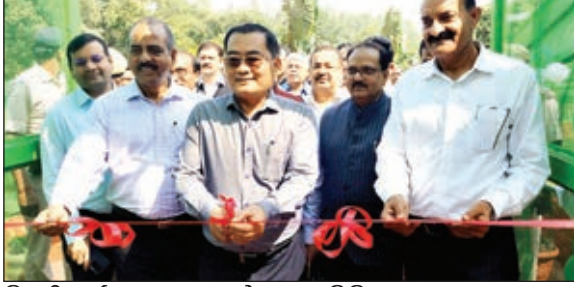
तितली पार्क का उद्घाटन करते मुख्य अतिथि