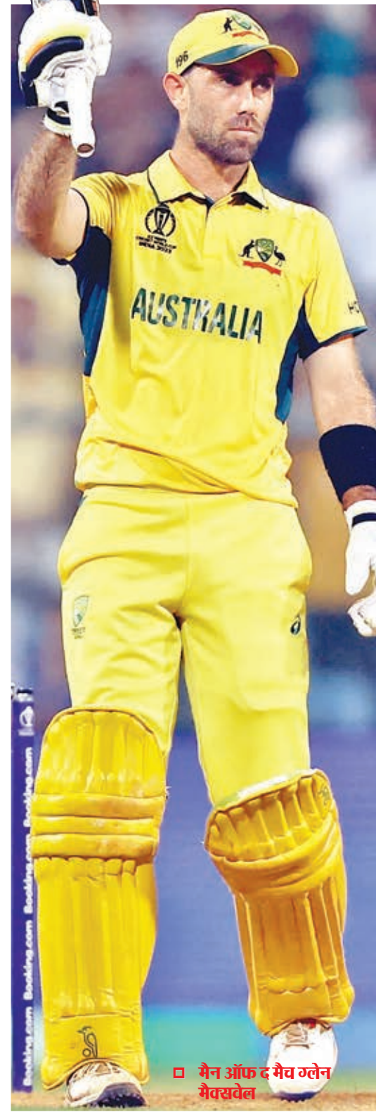
मैन ऑफ द मैच ग्लेन मैक्सवेल

□ अफगानिस्तान को हराकर □ विश्व कप में लक्ष्य का पीछा करते □ ऑस्ट्रेलिया सेमीफाइनल में, ऑस्ट्रेलिया ने रचा इतिहास □ ऑस्ट्रेलिया की सबसे बड़ी जीत □ अफगानिस्तान तीन विकेट से हारा