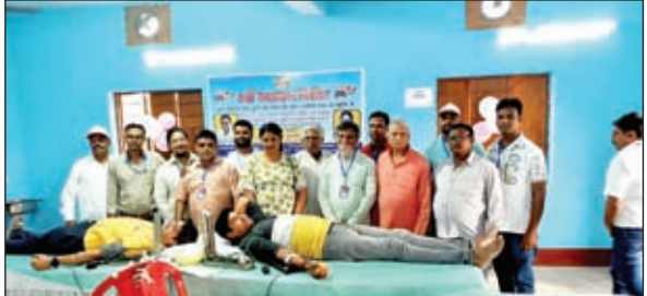
रक्तदान शिविर का दृश्य।