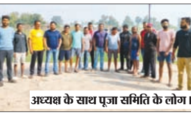
अध्यक्ष के साथ पूजा समिति के लोग।

बरवाडीह। आस्था के महापर्व छठ पूजा को लेकर प्रखण्ड मुख्यालय के आदर्श नगर छठ घाट पूजा समिति का गठन कर दिया गया है। जहां कमेटी के अध्यक्ष के