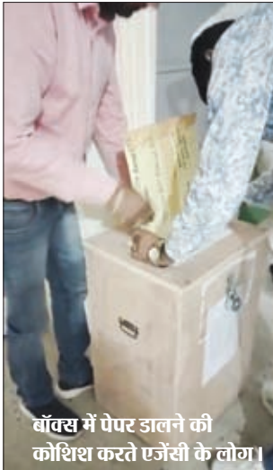
बॉल्स में पोपर डालने की कोशिश करते एजेंसी के लोग।

लातेहार। लातेहार जिला अंतर्गत आंगनबाड़ी केंद्रों में नामांकित 3 से 6 वर्ष के बच्चों के बीच गर्म पोशाक उपलब्ध कराने को लेकर जिला समाज कल्याण विभाग द्वारा निकाली गई निविदा में गड़बड़ी का मामला प्रकाश में आया है। इस निविदा से जिले के आपूर्तिकर्ताओं को बाहर रखने की सोची समझी साजिश रची गई है। जिससे ठीकेदारों में समाज कल्याण विभाग और जिला प्रशासन के इस व्यवहार को लेकर नाराजगी व्याप्त है। वहीं इसे लेकर चौक-