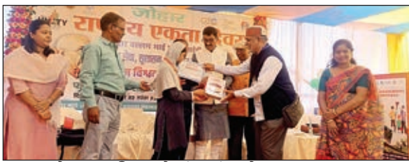
पुरस्कार देकर सम्मानित करते सांखद संजय सेठ व अन्य।

पिस्कानगड़ी। केंद्रीय संचार ब्यूरो और सूचना और प्रसारण मंत्रालय भारत सरकार द्वारा आयोजित तीन दिवसीय मल्टीमीडिया चित्र प्रदर्शनी, राष्ट्रीय एकता, मेरा माटी मेरा देश, प्रधानमंत्री विश्वकर्मा योजना, स्वच्छता आदि विषयो पर जागरूकता कार्यक्रम का आयोजन किया गया। दूसरे दिन के कार्यक्रम का उद्घाटन रांची सांसद संजय सेठ ने दीप प्रचलन कर एवं लौह पुरुष सरदार वल्लभभाई पटेल के चित्र पर माल्यार्पण कर किया। अपने संबोधन में संजय सेठ ने कहा भारत रत्न सरदार पटेल देश की रियासतों को एक सूत्र में बांधने और सारी रियासतों को एक करने