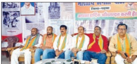
प्रेस कॉन्फ्रेंस करते भाजपाई