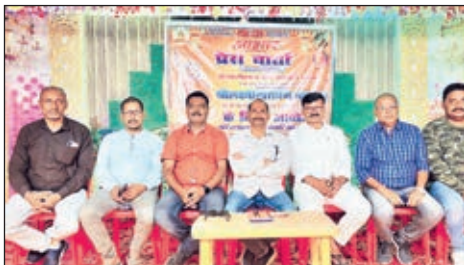
प्रेस कॉन्फ्रेंस करते यज्ञ कमिटी के सदस्य