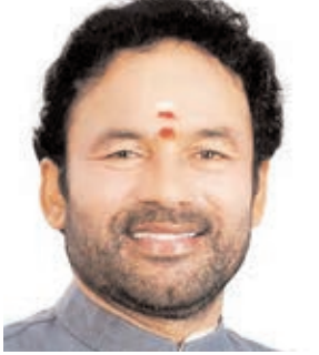
जी. किशन रेड्डी

(लेखक, केंद्रीय पूर्वोत्तर क्षेत्र विकास, पर्यटन एवं संस्कृतिसंरक्षक हैं।)