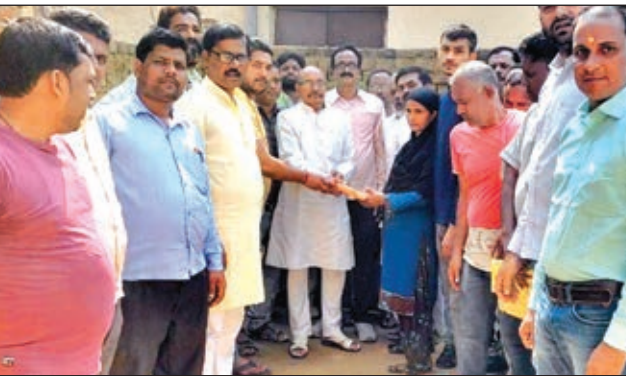
सहयोग राशि प्रदान करते कार्यकर्ता