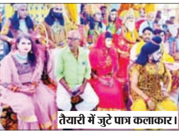
तेयारी में जुटे पात्र कलाकार।

पंचमुखी दुर्गापूजा पंडाल में आज होगा रामलीला का शुभारंभ