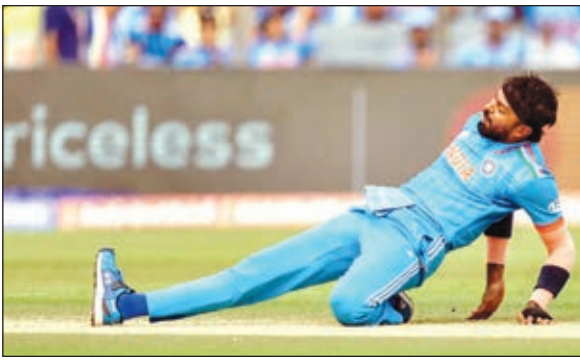
का अब भी इलाज चल रहा है। उनके बाएं टखने की सूजन काफी कम हो गई है, लेकिन वह इस सप्ताह के अंत में ही गेंदबाजी शुरू करेंगे। अभी

नयी दिल्ली। भारत के स्टार ऑलराउंडर हार्दिक पांड्या पिछले हफ्ते बांग्लादेश के खिलाफ मैच के दौरान चोटिल हो गए थे। उन्हें टखने में चोट लगी थी। बीसीसीआई ने जानकारी दी थी कि वह न्यूजीलैंड के खिलाफ मैच में नहीं खेलेंगे और 29 अक्टूबर को इंग्लैंड के खिलाफ होने वाले मैच से पहले लखनऊ में टीम इंडिया से जुड़ जाएंगे। हालांकि, अब उनको लेकर बड़ा अपडेट सामने आया है। इसी चोट की वजह से हार्दिक के भारत के अगले दो विश्व कप मैचों से बाहर बैठने की आशंका है। जानकारी के अनुसार वह अभी तक इससे उबर नहीं पाए हैं। हार्दिक पांड्या 19 अक्टूबर को पुणे में बांग्लादेश के खिलाफ खेलते हुए बॉलिंग में गेंद के फॉलोअप में फिसल गए थे और 22 अक्टूबर को धर्मशाला में न्यूजीलैंड के खिलाफ मैच में नहीं खेल पाए थे। बड़ौदा के इस खिलाड़ी ने चोट के प्रबंधन के लिए सोमवार को बंगलूरु में राष्ट्रीय क्रिकेट अकादमी को रिपोर्ट किया था। अब उनके इंग्लैंड और श्रीलंका के खिलाफ मैच से भी दूर रहने की आशंका है।