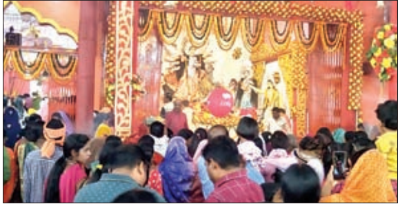
शक्ति संघ मंदिर में अष्टमी पूजा को लेकर जुटे श्रद्धालु।

से भक्त निकले। शाम होते ही गुमला जिला मुख्यालय के सभी पूजा पंडाल दुधिया प्रकाश से जगमग हो उठे। वैदिक मंत्रोच्चारण और भक्ति गीतों से