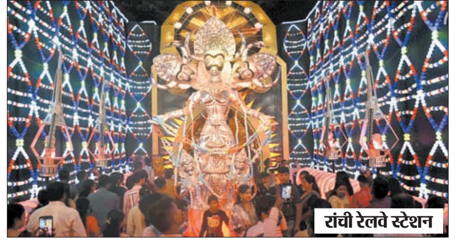
रांची रेलवे स्टेशन

शाम होते ही रंग बिरंगे रोशनी से जगमग आकर्षक पंडालों में स्थापित मां की प्रतिमा अपने भव्य स्वरूप में नजर आ रही थी। देर रात तक पूजा पंडाल में आने वाले भक्तों का तांता लगा था। मौसम सुहाना होने की वजह से इस बार पूजा की भव्यता और बढ़ गई है। अलग-अलग पूजा पंडालों में जागरण के साथ गरबा डांडिया का भी आयोजन किया गया था। पूजा पंडाल देखने वाले दर्शनार्थी स्वतः ही पूजा पंडाल में आयोजित गरबा डांडिया खेलने लग रहे थे।