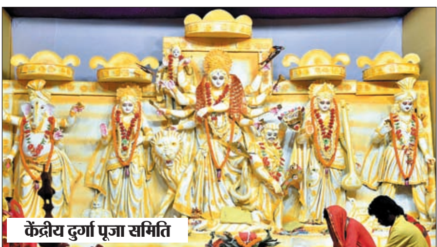
केंद्रीय दुर्गा पूजा समिति