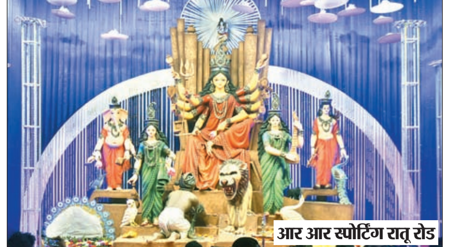
आर आर स्पोर्टिंग रातू रोड