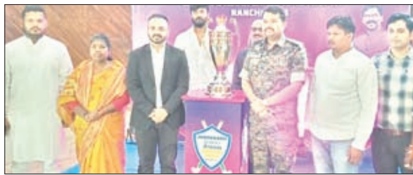
ट्रॉफी के अनावरण के समय डीसी व एएसपी।

ज्ञात हो कि वीमेंस एशियन हॉकी चैंपियनशिप-2023 का आयोजन रांची में 27 अक्टूबर से 5 नवंबर 2023 तक किया जा रहा है। दर्शकों के लिए प्रवेश नि:शुल्क