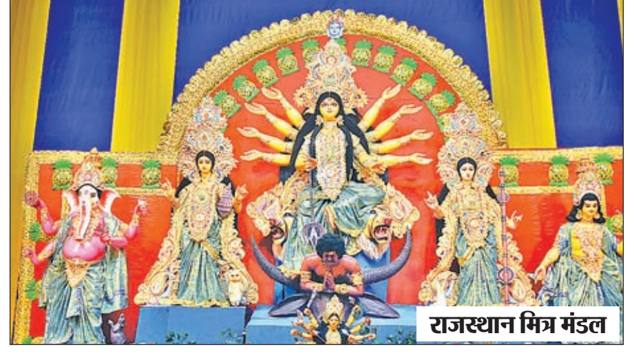
राजस्थान मित्र मंडल