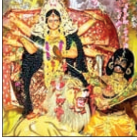
डुमरी में मां दुर्गा की प्रतिमा।

मेरी अखियों के सामने ही रहना मां शैला वाली जगदम्बे ..., महिलाओं ने अष्टमी का उपावास रखकर मां की पूजा-अर्चना कर सुख-समृद्धि की कामना की