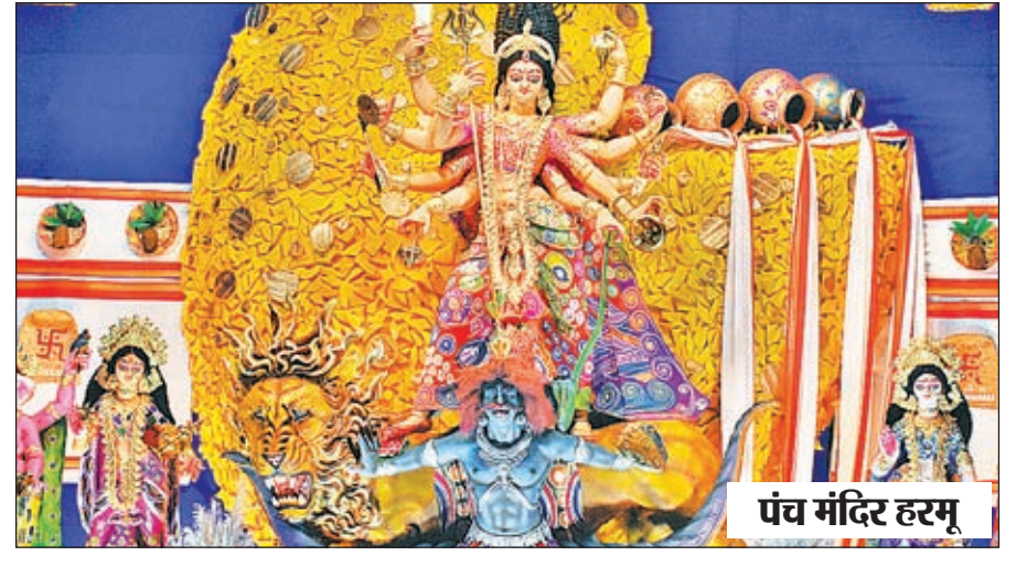
पंच मंदिर हरमू