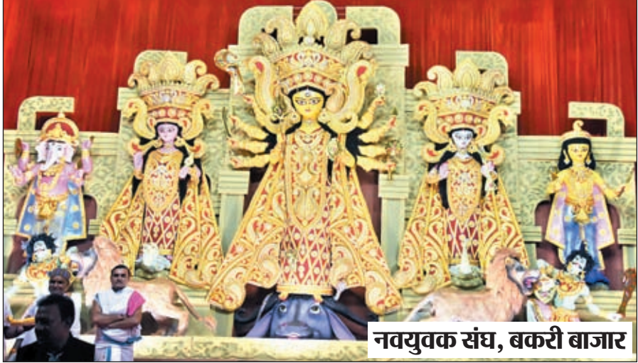
नवयुवक संघ, बकरी बाजार