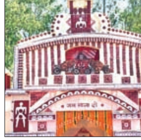
घाघरा थाना चौक में बना पंडाल।