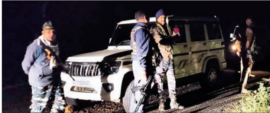
घटनास्थल पर रात में पहुंची विशुनपुर पुलिस।