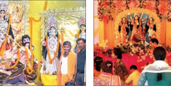
रोड स्थित शक्ति संघ में रविवार को वैदिक मंत्रोच्चार के साथ नवरात्र के आठवें दिन महागौरी की पूजा की गई। ज्योति संघ, शक्ति संघ, अरुणोदय संघ, उर्मा

संघ, मालवीय नगर करौंदी पूजा संघ, ज्योति संघ, अरुणोदय संघ, जय भवानी संघ, विश्व भारती संघ, उर्मा अरमई डुमरडीह पूजा संघ, पालकोट