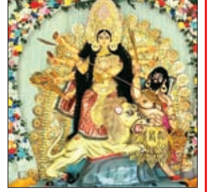
वैनपुर में मां की प्रतिमा।