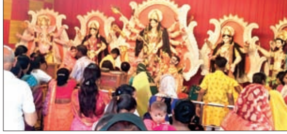
ज्योति संघ पूजा पंडाल में महाष्टमी की पूजा करती महिलाएं।