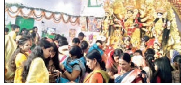
बड़ा दुर्गा मंदिर में अष्टमी पूजा करने पहुंचे लोग।