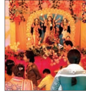
गुमला के अरुणोदय संघ में श्रद्धालु।

अरमई डुमरडीह पूजा समिति, विश्व भारती संघ, मां भवानी संघ आदि स्थानों में पूजा को लेकर आकर्षक विद्युत सज्जा की गई है।