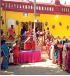
खोरा में महिलाओं की भीड़।

पूरे शहर में अध्यात्म की धारा प्रवाहित हो रहा था। पूजा को लेकर सनातन धर्मावलम्बियों में मां दुर्गा के प्रति आस्था और विश्वास का भाव झलक रहा था।