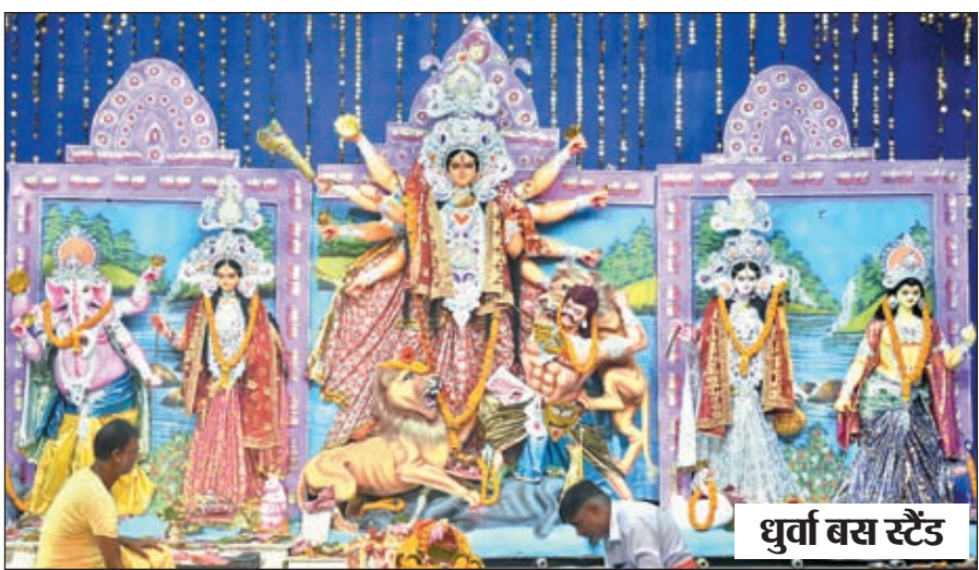
धुर्ता बस स्टैंड