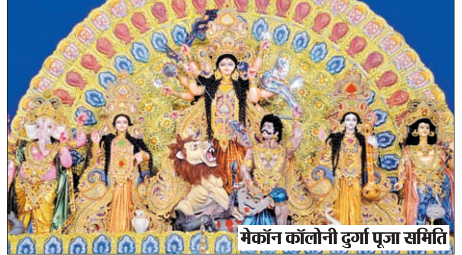
मेर्कॉन कॉलोनी दुर्गा पूजा समिति