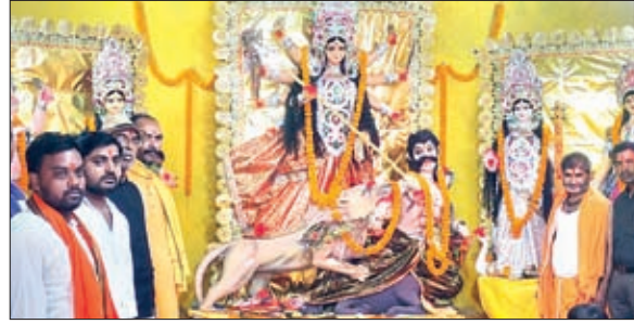
रायडीह में महाष्टमी पूजा करते पूजा समिति के सदस्य।

संघ, मालवीय नगर करौंदी पूजा संघ, ज्योति संघ, अरुणोदय संघ, जय भवानी संघ, विश्व भारती संघ, उर्मा अरमई डुमरडीह पूजा संघ, पालकोट