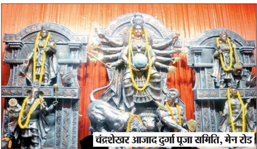
चंद्रशेखर आजाद दुर्गा पूजा समिति, मेन रोड