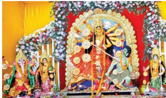
सौदा डी में मां दुर्गा की आकर्षक मूर्ति।

बौनर घौड़ा, जवाहर नगर, सौदा डी क्लब घर, जयनगर, सेंट्रल सौदा मैदान, सीसीएल सौदा क्लब घर, को-ऑपरेटिव, रिभर साईड शास्त्री पार्क, गांधी पार्क, नेहरू पार्क, भदानीनगर ग्लास फैक्ट्री, लपंगा, पटेलनगर, सौदा बस्ती, केके कोलियरी पोडा, सयाल, उरीमारी, चैनगड्डा, सयाल टिपला, दत्तो, पोडा, रसदा, बलकुदरा आदि कई जगहों पर एक से बढ़कर एक पूजा पंडालों का निर्माण हुआ है। विभिन्न मंदिरों के थीम पर पंडाल बने हैं।