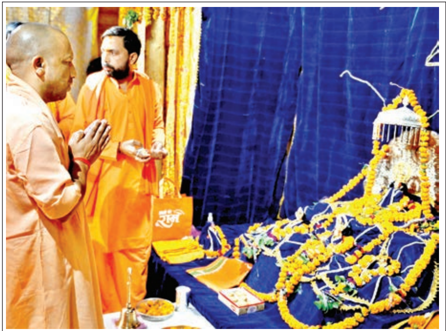
हनुमानगढ़ी मंदिर में शनिवार को हनुमंत लला की पूजा करते यूपी के सीएम योगी आदित्य नाथ।