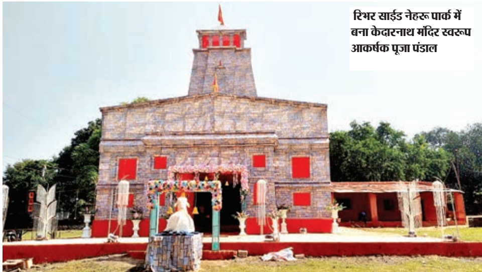
रिभर साईड नेहरू पार्क में बना केदारनाथ मंदिर स्वरूप आकर्षक पूजा पंडाल

पूजा पंडाल लोगों के लिए आकर्षण का केंद्र बना हुआ है। इस बार भी भुरकुंडा कोयलांचल सहित आसपास क्षेत्रों में दो दर्जन से अधिक जगहों पर पूजा पंडाल बने हैं। भुरकुंडा पूरणराम चौक, बिरसा चौक, रिकरेशन क्लब,