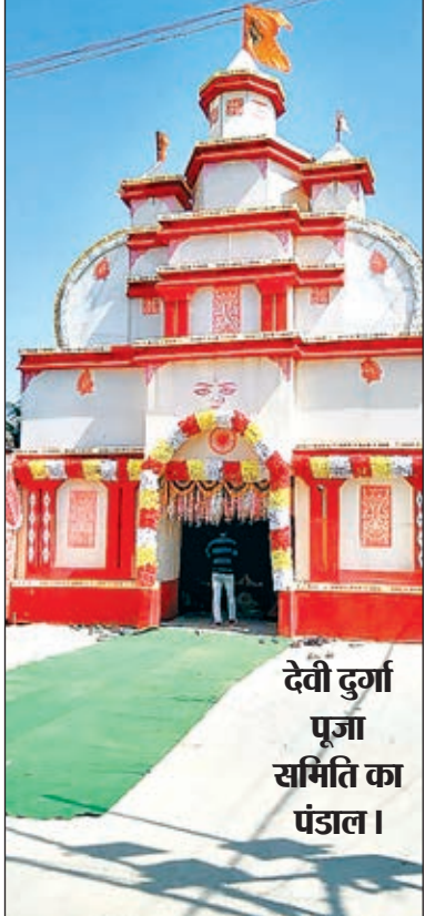
देवी दुर्गा पूजा समिति का पंडाल।

सामूहिक महाआरती के बाद विश्व कल्याण की कामना मां दुर्गा से की गयी। शारदीय नवरात्र की सप्तमी पूजा के साथ ही पूजा पंडालों के कपाट आम श्रद्धालुओं के लिए खोल दिया गया। पूजा पंडालों के पट खुलते ही माता के दर्शन के लिए श्रद्धालुओं की भीड़ उमड़ पड़ी। शाम होते ही गुमला जिला मुख्यालय के सभी पूजा पंडाल दुधिया प्रकाश से जगमग हो उठे। वैदिक मंत्रोच्चारण और भक्ति गीतों से पूरे शहर में अध्यात्म की धारा प्रवाहित हो रहा था। सनातन धर्मावलंबियों ने मां दुर्गा के प्रति आस्था और विश्वास का भाव झलक रहा था। लोगों में