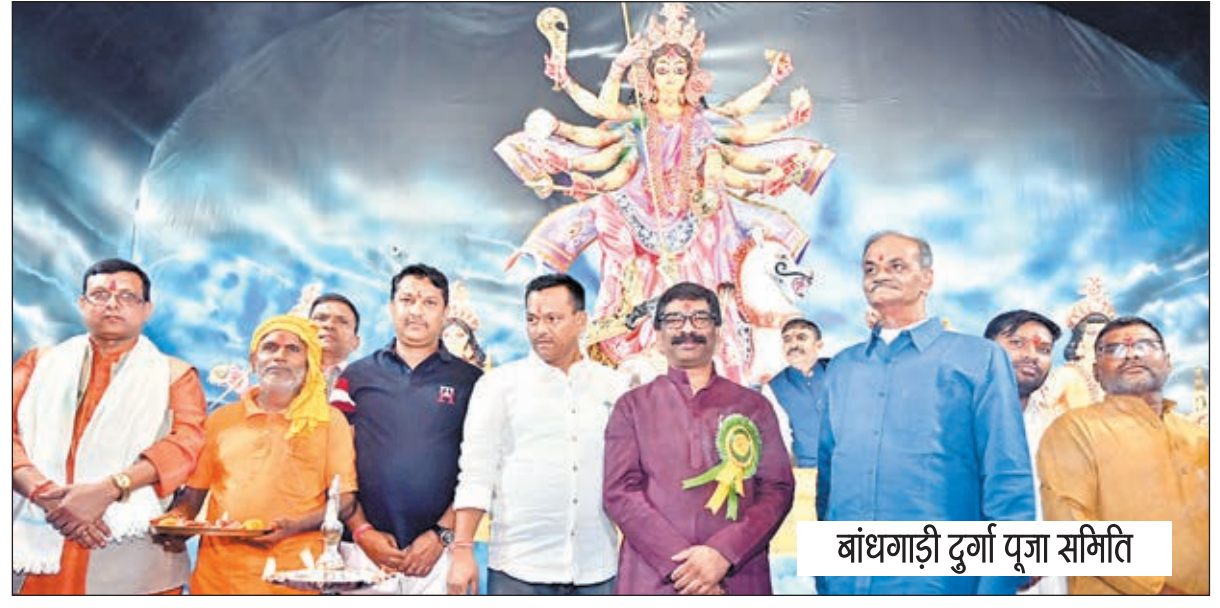
बांधगाड़ी दुर्गा पूजा समिति