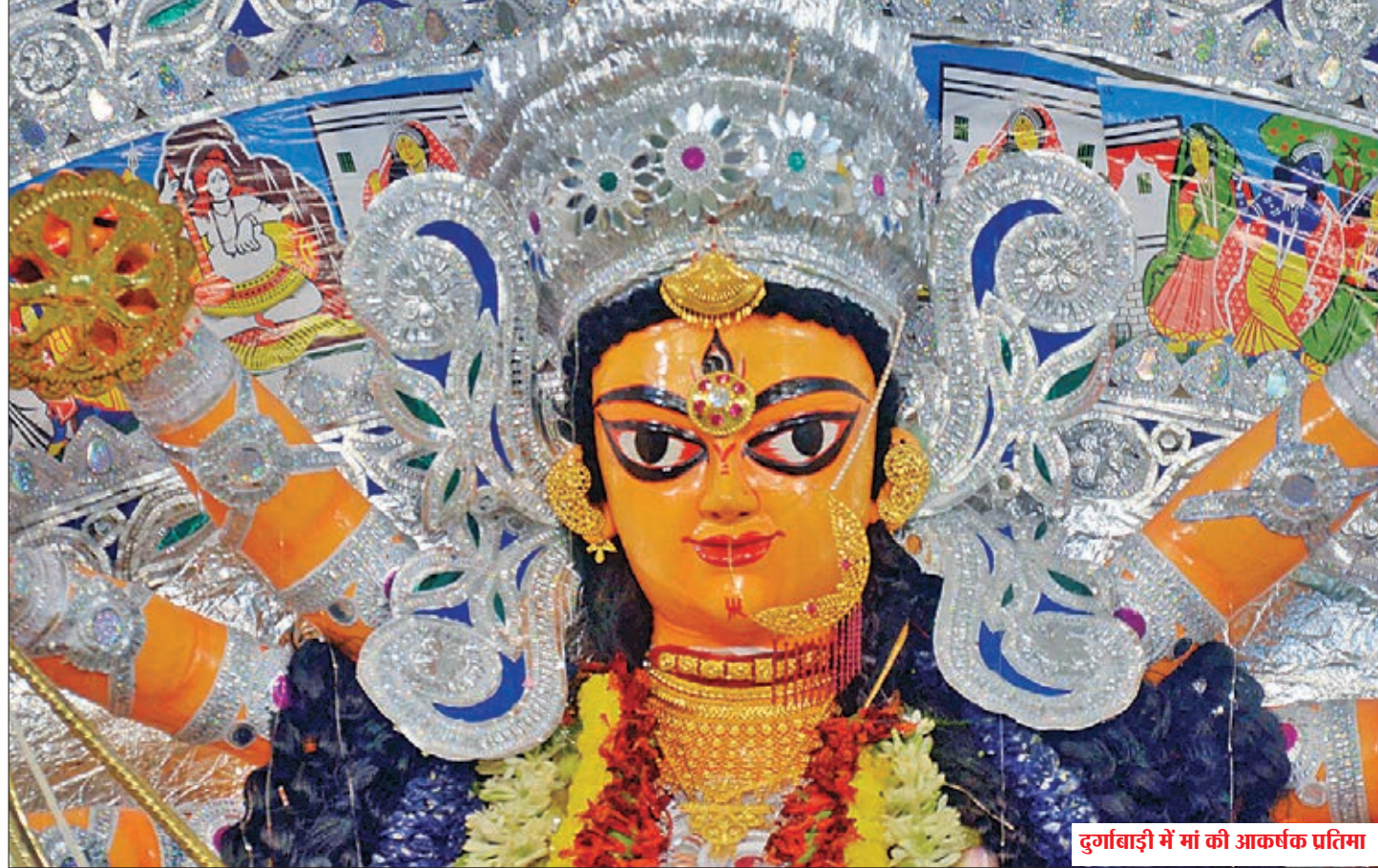
दुर्गावाड़ी में मां की आकर्षक प्रतिमा

एतिहासिक श्रीश्री दुर्गावाड़ी में शुक्रवार को प्रातः 6:23 बजे मां दुर्गा का पट खुला। पट खुलते ही महापृथ्वी पूजा के अवसर पर दुर्गा वाड़ी में लोगों का तांता लगा रहा। सांय काल में देवी का बोधन, आमंत्रण एवं अधिवास हुआ इसके पश्चात मां भगवती का शृंगार किया गया। वहीं शुक्रवार शाम सीएम हेमंत