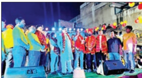
मंघासीन पूर्व विधायक व अन्य