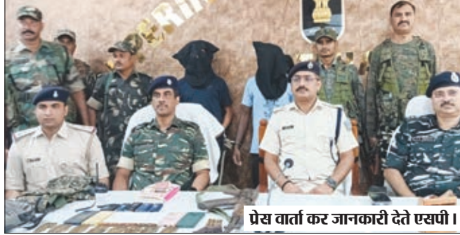
प्रेस वार्ता कर जानकारी देते एसपी।