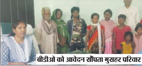
बीडीओ को आवेदन सौंपता मुसहर परिवार।

मुसहर परिवार ने बीडीओ को सौंपा आवेदन आधार कार्ड बनवाने की मांग की