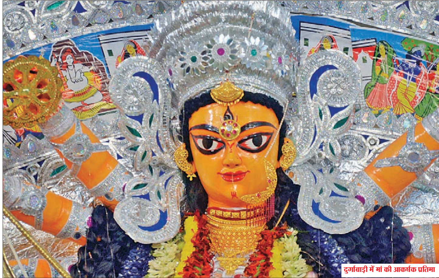
दुर्गावाड़ी में मां की आकर्षक प्रतिमा

एतिहासिक श्रीश्री दुर्गावाड़ी में शुक्रवार को प्रातः 6:23 बजे मां दुर्गा का पट खुला। पट खुलते ही महापृथ्वी पूजा के अवसर पर दुर्गा वाड़ी में लोगों का तांता लगा रहा। सांय काल में देवी का बोधन, आमंत्रण एवं अधिवास हुआ इसके पश्चात मां भगवती का शृंगार किया गया। वहीं शुक्रवार शाम सीएम हेमंत