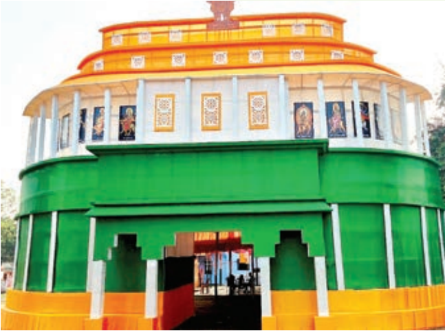
सौदा डी में बना पुराना संसद भवन का आकर्षक पूजा पंडाल।