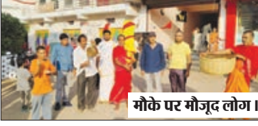
मौके पर मौजूद लोग।

शारदीय नवरात्र के छठे दिन की गयी मां कात्यायनी की आराधना