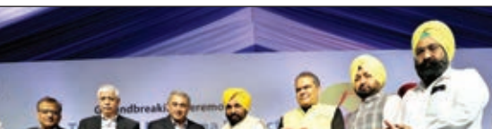
भूमि पूजन समारोह में उपस्थित सीएम भगवंत मान, टाटा स्टील के सीडओ टीवी नरेंद्रन, टीपी चाणवत चौधरी व अन्य।

2600 करोड़ की लागत से बन रहा इलेक्ट्रिक अर्क फ़नेस स्टील प्लांट सीएम मंगलंत मान संजय चौधरी के सीडओ टीवी नरेंद्रन ने किया भूमि पूजन