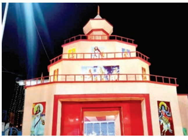
रिक्शन क्लब थाना चौक में पूजा पंडाल।

उमड़नी शुरू हो जाएगी, जो विजय दशमी तक बनी रहेगी। शारदीय नवरात्र पर शुक्रवार को महाशष्ठी पर विधि-विधान से बेलवरण की पूजा हुई। इस अवसर पर गाजे-बाजे के साथ बेल वृक्ष के नीचे पूजा कर मां को आमंत्रित किया गया। साथ ही श्री दुर्गा पूजा पंडालों में शारदीय नवरात्र पर मां दुर्गा के छठे स्वरूप मां कात्यायनी की पूजा जाएगी। इसके बाद मां दुर्गा, मां सरस्वती, मां लक्ष्मी, भगवान गणेश, भगवान कार्तिकेय पूजा-अर्चना व दर्शन के लिए भक्तों की भारी भीड़