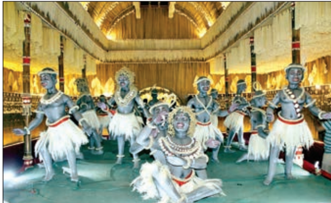
पंडाल के अंदर की झांकी।

नौ रूपों में मां स्कंदमाता शांति, शीतला और भव्यता पा प्रतीक होता है। आज के दिन पूजा कमिटी ने पंडाल का पट खोल कर पूरे शहर में भी शांति का संदेश दिया है। दुर्गा पूजा शक्ति की उपासना के लिए