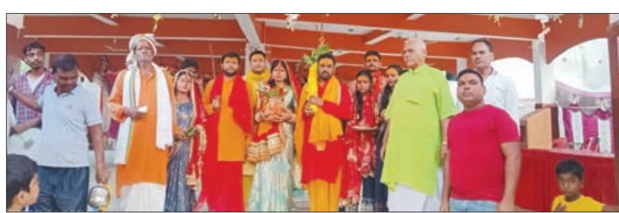
लातेहार। शारदीय नवरात्र के सप्तमी तिथि 21 अक्टूबर