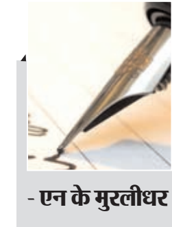
- एन के मुस्तीधर

माता सती की नामी यहां गिरी थी! तब कहीं जाकर काली नदी के तट पर बना ये शक्तिपीठ