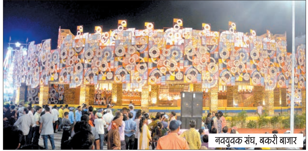
नवयुवक संघ, बकरी बाजार