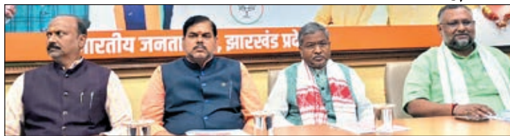
खबर मन्त्र व्यूटो

रांची। भाजपा प्रदेश मुख्यालय में बुधवार को प्रधानमंत्री विश्वकर्मा योजना की कार्यशाला हुई। प्रदेश अध्यक्ष बाबूलाल मरांडी ने कहा कि पीएम विश्वकर्मा योजना गांव के पारंपरिक रोजगार, हुनर और कौशल को बढ़ावा देने की योजना है। इस योजना के तहत गांव-गांव के पारंपरिक कारीगरों को ज्यादा से ज्यादा लाभ मिल सके, इसकी कार्य योजना बनाने पर बल दिया। उन्होंने कहा कि इस कार्यक्रम के माध्यम से पारंपरिक कारीगरों को समर्थ, सक्षम व समृद्ध बनाना प्रधानमंत्री नरेंद्र मोदी का मुख्य उद्देश्य है। प्रधानमंत्री नरेंद्र मोदी ने इस योजना के लिए 13,000 करोड़ रुपये अलग से आवंटित किये हैं। इस कार्यक्रम से