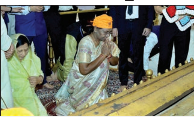
तख्त श्री में सिर झुकाती राष्ट्रपति द्रौपदी मुर्मू।

मांगी देश के लिए सुख समृद्धि और तरक्की खबर मन्त्र ब्यूरो जमशेदपुर/पटना। राष्ट्रपति द्रौपदी मुर्मू बुधवार को गुरु गोविंद सिंह जी को जन्मस्थली तख्त श्री हरमंदिर जी पटना साहिब पहुंची और नतमस्तक हुईं। यहां वे