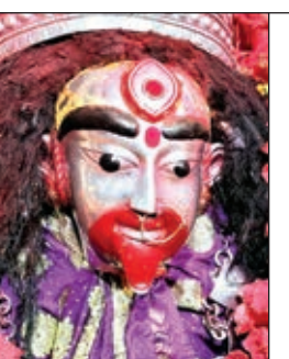
वाली कहने के कारण माता को तारा कहा जाता है। तारापीठ में

रांची। शारदीय नवरात्रि का हर दिन मां को समर्पित है। नवरात्रि के 9 दिनों में मां दुर्गा के अलग-अलग नौ रूपों की पूजा की जाती है। इन नौ दिनों तक घरों, मंदिरों में विधिविधान से पूजन-अर्चन कर भक्त मां भगवती से आशीर्वाद प्राप्त करते हैं। नवरात्रि में मां तारा की पूजा और साधना करना बहुत ही पुण्य फलदायी माना जाता है। तारने