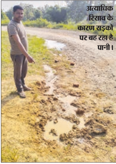
अत्यधिक रिसाव के कारण सड़को पर बह रहा है पानी।

लाइन का निरीक्षण किया। उन्होंने खबर मंत्र को बताया कि ठिकेदार द्वारा योजना में सिर्फ घोटाला किया गया है। इससे आने वाले दिनों में इस योजना के लाभ से ग्रामीण पूरी तरह वंचित रह जाएंगे। ठिकेदार तो अपना बिल लेकर फरार हो जाएगा। बताया कि योजना के तहत घरों में नल तो लगा दिया गया है, लेकिन नल से पानी नहीं गिर रहा है। इसका मुख्य कारण है कि बिछाए गए पाइप लाइन के हर ज्वाइंट पर पानी का रिसाव अधिक मात्रा में हो रहा है। जिससे लोगों के घरों तक पहुंचने से पहले ही पानी सड़क पर बह जा रहा है। जबकि ठिकेदार यहां