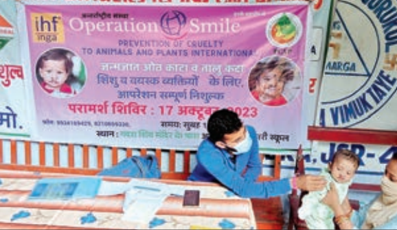
शिविर में बच्चों की जांच करते चिकित्सक।

जमशेदपुर। आज मंगलवार को आनन्द मार्ग जागृति में आज प्रिवेंशन अफ क्रैबिलिटी एनिमल्लस एंड प्लांट्स, अपरेशन स्माइल, इंगा हेल्थ फाउंडेशन एवं आनंद मार्ग यूनिवर्सल रिलीफ टीम ग्लोबल के प्रयास से जन्मजात ओट कटा तालुकटा रोगी के लिए निःशुल्क अपरेशन हेतु जांच शिविर का आयोजन सुबह 10 बजे से 4 बजे तक जांच शिविर आयोजित किया गया इस शिविर में कुल 15 मरीज आये इसमें 9ओट एवं तालू कटा, 1 केवल तालू कटा पाए गए। 5 कुपोषण युक्त बच्चे मिले जिनको लेक्टोजन एवं औषधि निःशुल्क उपलब्ध कराया गया हान मरीजों