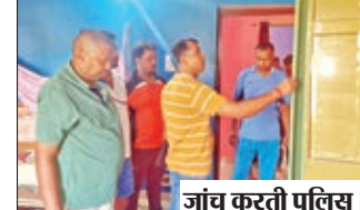
जांच करती पुलिस।