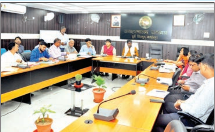
समीक्षा बैठक करते डीसी मंजूनाथ भजन्त्री व उपस्थित अन्य पदाधिकारीगण।

जमशेदपुर। समाहरणालय सभागार, जमशेदपुर में जिला दण्डाधिकारी-सह-उपायुक्त (डीसी) मंजूनाथ भजन्त्री की अध्यक्षता में जिला खनिज फाउंडेशन ट्रस्ट (डीएमएफटी) एवं अनाबद्ध निधि के तहत जिले में हो रहे विकास कार्यों की समीक्षा बैठक आहूत की गई। बैठक में पथ निर्माण विभाग, स्पेशल डिविजन, पीएचईडी, आरईओ, लघु सिंचाई,