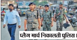
पल्लेग मार्च निकालती पुलिस।