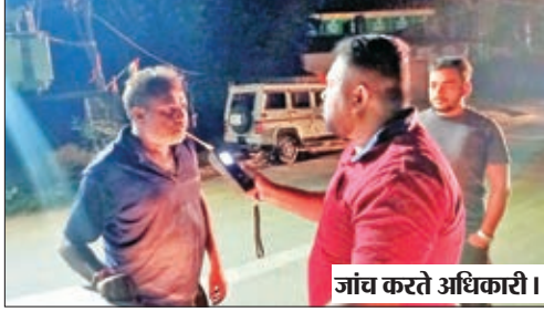
जांच करते अधिकारी।