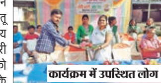
कार्यक्रम में उपस्थित लोग।

बारियातू। नेहरु युवा केंद्र संगठन लातेहार के तत्वाधान में बारियातू प्रखंड मुख्यालय स्थित राजकीय कृत आदर्श मध्य विद्यालय में मेरी माटी मेरा देश कार्यक्रम सोमवार को आयोजन किया गया। कार्यक्रम के