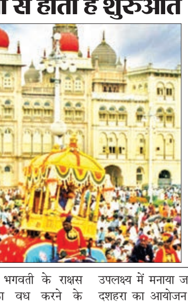
750 किलो के स्वर्ण सिंहासन से नगर भ्रमण पर निकलती हैं माता दसवें दिन मनाये जाने वाले उत्सव को जबू सवारी के नाम से जाना जाता है और इसमें बच्चे बड़े सभी लोग शामिल होते हैं। साथ ही सोने और 21 तोपों की सलामी के बाद मैसूर राजमहल से निकलता है। इस दिन सभी की निगाहें गजराज के सुनहरे होंदे पर टिकी होती हैं। इसी होंदे पर चामुंडेश्वरी देवी मैसूर नगर भ्रमण के लिए निकलती हैं और उत्सव के साथ अन्य गजराज भी साथ निकलते हैं। साल भर में यही एक मौका होता है, जब देवी मां 750 किलो के सोने के सिंहासन पर विराजमान होकर नगर भ्रमण के लिए निकलती हैं।

कर्नाटक के शहर मैसूर में दशहरे का आयोजन दस दिन तक होता है और इस त्योहार में लाखों की तादात में पर्यटक शामिल होते हैं। इस दशहरा को नवाबबा कहते हैं। इस उत्सव की शुरुआत देवी चामुंडेश्वरी मंदिर में पूजा अर्चना के साथ शुरू होती है। चामुंडेश्वरी देवी की पहली पूजा शाही परिवार करता है। इस पर्व में मैसूर का शाही वीडेयार परिवार समेत पूरा मैसूर शहर शामिल होता है।