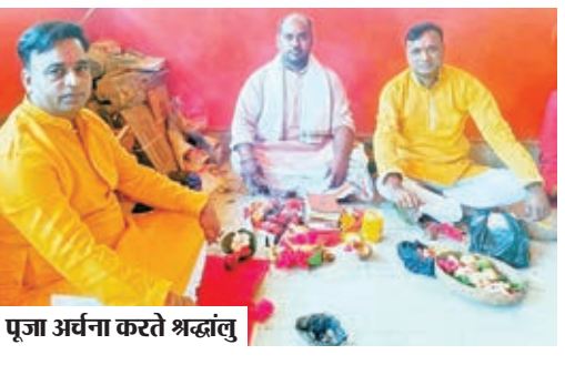
पूजा अर्चना करते श्रद्धालु