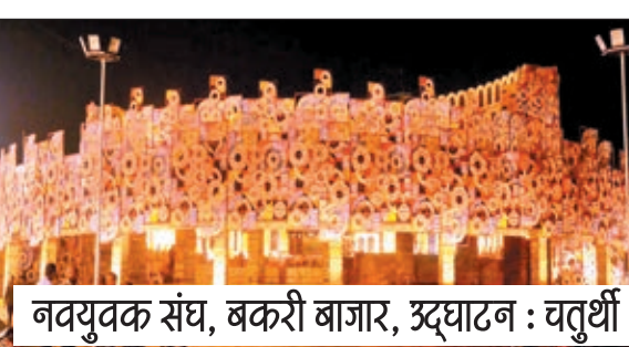
नवयुवक संघ, बकरी बाजार, उद्घाटन : चतुर्थी

नेचुरल और प्रकृति से जुड़ी चीजों से की जा रही है। कांटा टोली नेताजी नगर पंचमी के दिन अपने पंडाल का पट खोलेगा। यहां आपको दक्षिण का फेमस न्यू कुचिपुड़ी पंडाल के बहारी भाग में देखने को मिलेगा। श्री श्री बांधगाड़ी दुर्गा पूजा समिति का पंडाल का पट पंचमी के दिन खोलेगा। यहां श्री हरि विष्णु के निवास स्थान क्षीरसागर का दर्शन कर सकते हैं।