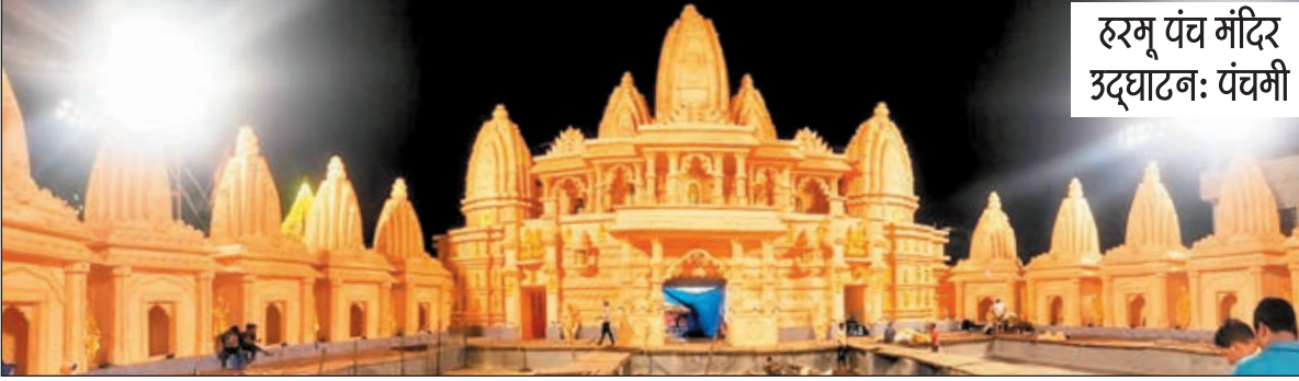
हरमू पंच मंदिर उद्घाटन: पंचमी

रांची। चंद्रशेखर आजाद क्लब मेन रोड अपने पंडाल का पट पंचमी के दिन खोलेगा। यहां अनातन धर्म की थीम पर पंडाल बन रहा है।