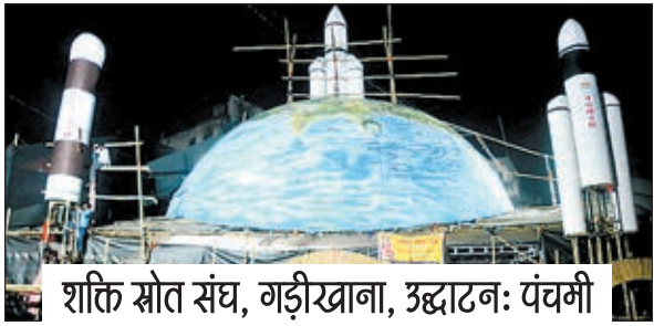
शक्ति स्रोत संघ, गड़ीखाना, उद्घाटन: पंचमी

रांची। राज्यभर में दुर्गा पूजा उत्सव की धूम है। शारदीय नवरात्र शुरू होने के साथ ही राजधानी रांची में भी दुर्गापूजा उत्सव अपने चरम पर है। हर बार की तरह इस बार भी सभी दुर्गापूजा कमेटियां उत्सव को यादगार बनाने के लिए कुछ न कुछ खास करने में जुटी हुई हैं। भारतीय युवक संघ बकरी बाजार का पूजा पंडाल महाभारत के चक्रव्यूह के आधारित थीम पर बन रहा है। जिसे बनाने में 60 लाख रुपए की लागत लगाने का अनुमान है। वहीं हरमू पंच मंदिर दुर्गा पूजा समिति का पंडाल श्री नारायण मंदिर अहमदाबाद की तर्ज पर बनाया जा रहा है, जिस पर 50 लाख रुपए खर्च किए जायेंगे। तीसरे नंबर पर आर आर स्पोर्टिंग क्लब का पूजा-पंडाल है, जो भगवान बुद्ध की जीवन यात्रा पर आधारित होगी। जिसे बनाने में 42 लाख रुपए खर्च आने का अनुमान है। इसके अलावा सत्य अमर लोक दुर्गा पूजा समिति, रांची रेलवे स्टेशन दुर्गा पूजा समिति, अरगोड़ा दुर्गा पूजा समिति, चन्द्रशेखर आजाद पूजा समिति, ओसीसी क्लब पूजा समिति बांग्ला स्कूल, राजस्थान मित्र मंडल