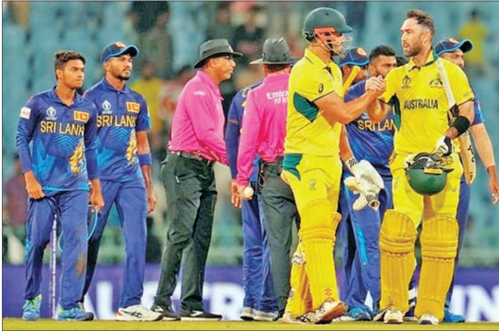
डेविड वार्नर (11) और फिर स्टीव स्मिथ (0) को एक ही ओवर में आउट कर ऑस्ट्रेलिया को फंसा दिया था। मगर इसके बाद तीसरे विकेट के लिए मार्श और मार्नस लाबुशेन (40) के बीच बढ़िया साझेदारी हुई तभी मार्श रन आउट