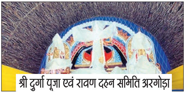
श्री दुर्गा पूजा एवं रावण दहन समिति अरगोड़ा