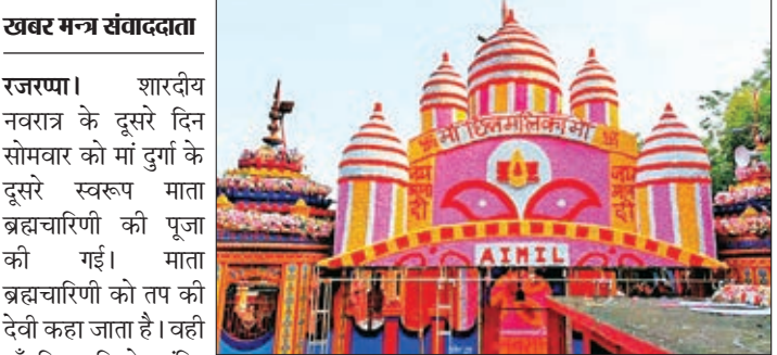
रजरप्पा मंदिर को दक्षिणेश्वर काली मंदिर की तर्ज पर सजावट हुई।