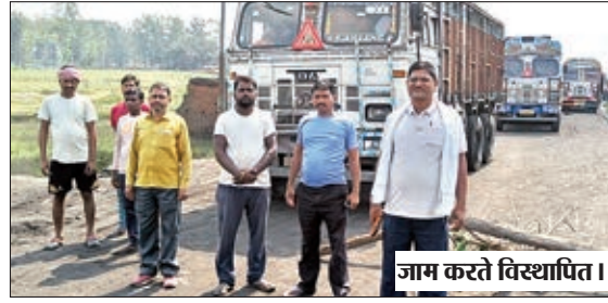
जाम करते विस्थापित।

बालूमाथ। सीसीएल द्वारा संचालित तेतरियाखांड कोलियरी में पूर्व निर्धारित कार्यक्रम के तहत विस्थापितों द्वारा नौकरी मुआवजा की मांग को लेकर सोमवार को चक्का जाम किया गया। चक्का जाम के दौरान सैकड़ों ट्रक जाम में फंसे रहे। जाम सुबह 10 बजे से दोपहर एक बजे तक रहा। जिसकी सूचना के बाद परियोजना पदाधिकारी के ऑफिस यादव के द्वारा विस्थापितों को उनकी समस्या का हल करने का आश्वासन मिलने के बाद जाम समाप्त हो पाया। परियोजना पदाधिकारी द्वारा जामकर्ताओं से कहा गया की अभी त्योंहार का समय चल रहा है। भूमि संबंधित विवाद को लेकर अगले महीना 10 नवंबर को बैठक बुलाई जाएगी। जिसमें आप सभी उपस्थित होकर अपना पक्ष