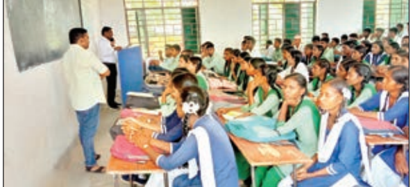
कार्यक्रम में उपस्थित लोग