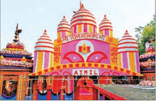
रजरप्पा मंदिर को दक्षिणेश्वर काली मंदिर की तर्ज पर सजावट हुई।