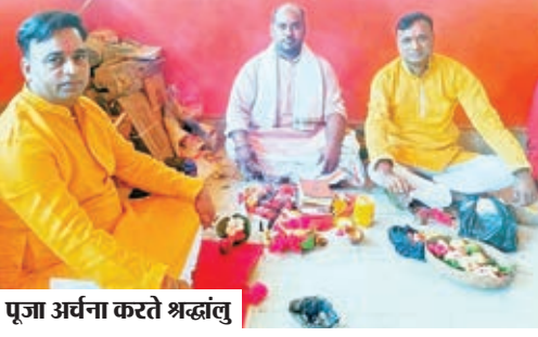
पूजा अर्चना करते श्रद्धालु