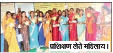
प्रशिक्षण लेते महिलाय।