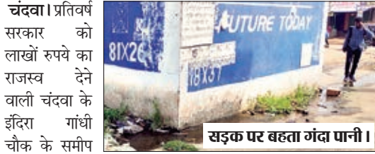
सड़क पर बहता गंद पानी।

चंदवा। प्रतिवर्ष सरकार को लाखों रुपये का राजस्व देने वाली चंदवा के इंदिरा गांधी चौक के समीप स्थित जिला परिषद बस पड़ाव प्रांगण में लगे जल मीनार व शौचालय से निकलकर सड़क पर लगातार बह रहे गंदे पानी से लोग परेशान है। पवित्र शारदीय नवरात्र को देखते हुए प्रशासन के द्वारा चंदवा शहर में सड़क पर बहने वाले गंदे पानी के निस्तारण को लेकर निर्देश भी दिया गया था, बावजूद इसके सड़क पर बह रहे गंदे पानी के निकास की कोई व्यवस्था नहीं की गई है। जिस कारण नवरात्र पूजा के क्रियाओं को काफी दिक्कतों का सामना करना पड़ रहा है। स्थानीय लोगों ने कहा कि बस पड़ाव परिसर में लाखों रुपये की लागत से नया शौचालय का निर्माण कराया गया, लेकिन उसको अब तक शुरू नहीं किया गया है। ऐसे में प्रतिदिन बस पड़ाव पहुंचने वाले यात्री पुराने शौचालय में ही जाते हैं, जहां गंदे पानी के निस्तारण को लेकर कोई व्यवस्था नहीं है, जिस कारण वहां से लगातार गंद पानी निकलता रहता है व बहते बहते एगएग पहुंच जा रहा है। जिससे सड़क तो खराब हो ही रही है, साथ ही सड़क किनारे फुटपाथ पर दुकान लगाने वाले लोगों व आम यात्रियों को भी परेशानी हो रही है। सड़क पर बह रहे पानी से वाहन के गुजरने के बाद गंदे पानी का छीटा भी लोगों के कपड़ों पर पड़ता है। ऐसे में पवित्र नवरात्र के दौरान श्रद्धालुओं की दिक्कत काफी बढ़ गयी है। लोगों ने सड़क पर बह रहे पानी की समस्या से निजात दिलाने की मांग स्थानीय प्रशासन से ही है।