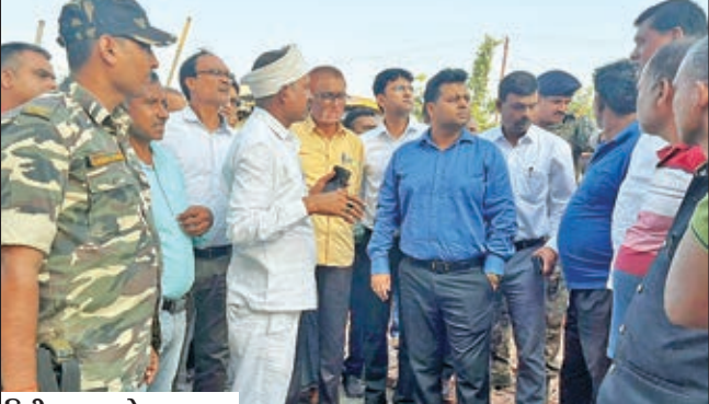
निरीक्षण करते उपायुक्त