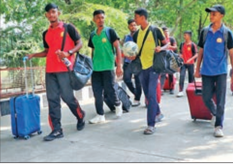
फुटबॉल टूर्नामेंट के लिए पहुंची टीमों