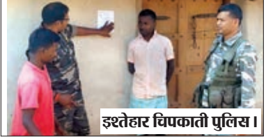
इश्टेहार चिपकाती पुलिस।