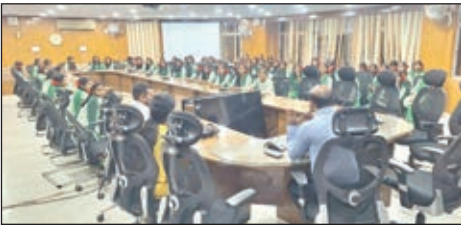
खबर मन्त्र संवाददाता

कोडरमा। जिले के सतगावां प्रखंड स्थित कस्तूरबा गांधी आवासीय विद्यालय के कक्षा नवम से लेकर 11-12वीं की छात्राओं ने उपायुक्त को ज्ञापन सौंप कर उचित कार्रवाई की मांग की। बाद में डीडीसी ऋतुराज छात्राओं से मिले और उनकी समस्याओं को सुने तथा उचित कार्रवाई का भरोसा दिया। उपायुक्त को सौंपे गए ज्ञापन में छात्राओं ने कहा है कि विद्यालय में तीन अंशकालिक शिक्षक के नही रहने से उनकी पढ़ाई प्रभावित हो रही है, जबकि निकट समय में ही परीक्षा है, शिक्षकों के हट जाने से स्कूल में पढ़ाई पूरी तरह चौपट हो गया है, ऐसे में हटाए गए शिक्षकों को पुनः बहाल किया जाए। ज्ञापन में कक्षा नवम से लेकर 12वीं कक्षा की छात्राओं का हस्ताक्षर है। इसके पूर्व छात्राओं ने डीडीसी के समक्ष स्कूल की कमियों की ओर ध्यान आकर्षित करवाते हुए उनके समाधान की मांग की, जिस पर डीडीसी ने मामले की जांच कर उचित कार्रवाई करने का आश्वासन दिया।