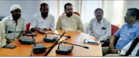
प्रेस कॉन्फ्रेंस करते झारखंड राज्य कृषि विपणन पार्षद के अध्यक्ष व अन्य।

■ झारखंड सरकार पुनः करेगी गठित, किसानों को मिलेगा लाभ, विभाग करेगा राजस्व की वसूली