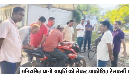
अनियमित पानी आपूर्ति को लेकर आक्रोशित रेलकर्मी।