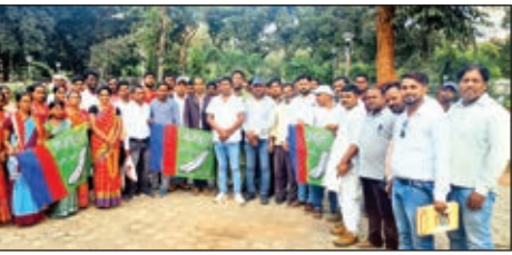
बैठक के बाद एकजुट आजसू कार्यकर्ता।

>> आजसू पार्टी की बैठक संपन्न खबर मन्त्र संवाददाता गुमला। आजसू पार्टी गुमला की आवश्यक बैठक गुरुवार को स्थानीय पत्रसदन में हुई। बैठक में आजसू पार्टी के केंद्रीय अध्यक्ष के निर्देशानुसार सभी जिला में संगठन को मजबूत करने व जिला के सभी प्रखंड कमेटी पंचायत कमेटी एवं ग्राम कमेटी तक संगठन का विस्तार कर सक्रिय सदस्य बनाने का लक्ष्य मिला था।