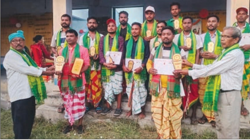
रक्तदाताओं को स्मृति चिह्न और अंग देकर सम्मानित करते गामिणी समाजसेवी।