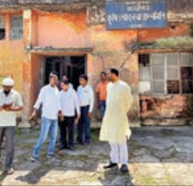
समिति के निरीक्षण के दौरान उन्होंने पाया कि बाजार समिति का भवन जर्जर अवस्था में है एवं वहां किसानों से ज्यादा व्यापारियों की अधिक दुकानें हैं।

■ झारखंड राज्य कृषि विपणन पार्षद के अध्यक्ष ने बाजार समिति व बाजार टांड का किया निरीक्षण