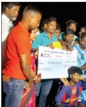
प्राज्ञ वितरण करते अतिथि।