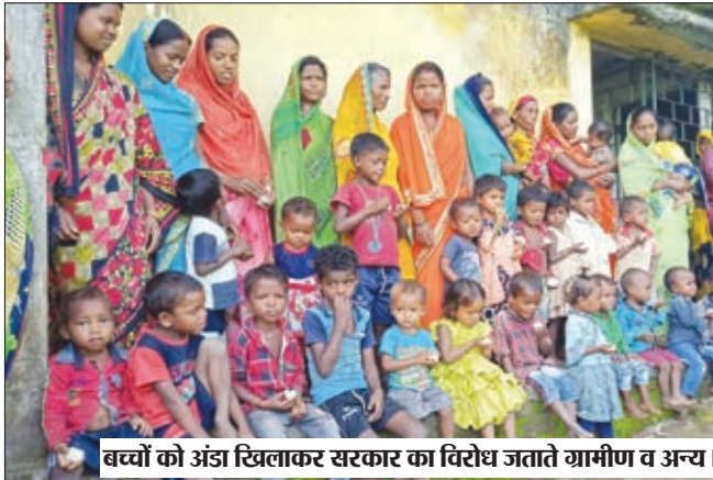
बच्चों को अंडा खिलाकर सरकार का विरोध जताते ग्रामीण व अन्य।