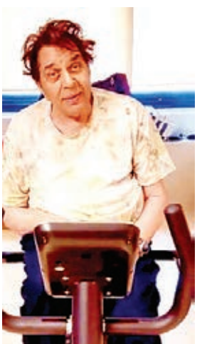
वह जल्द ही कई बड़े प्रोजेक्ट्स में दिखाई देंगे।

मुंबई। बॉलीवुड के जानेमाने अभिनेता धर्मोन्द्ध ने सोशल मीडिया पर अपना वर्कआउट वीडियो शेयर किया है। धर्मोन्द्ध ने अपने सोशल हैंडल अकाउंट पर अपना एक्सरसाइज करते हुए एक वीडियो शेयर किया है। वीडियो में धर्मोन्द्ध ब्लू ट्राउजर के साथ प्रिंटेड फुल-स्लीव टीशर्ट पहने नजर आ रहे हैं। वह साइक्लिंग करते हुए दिखाई दिए। वीडियो को शेयर करते हुए धर्मोन्द्ध ने कैप्शन में लिखा, दोस्तों मैं आपसे बहुत प्यार करता हूँ। धर्मोन्द्ध के इस वीडियो को उनके फैंस काफी पसंद कर रहे हैं। धर्मोन्द्ध अंतिम बार फिल्म रांकी और रांकी की प्रेम कहानी में नजर आये। अब