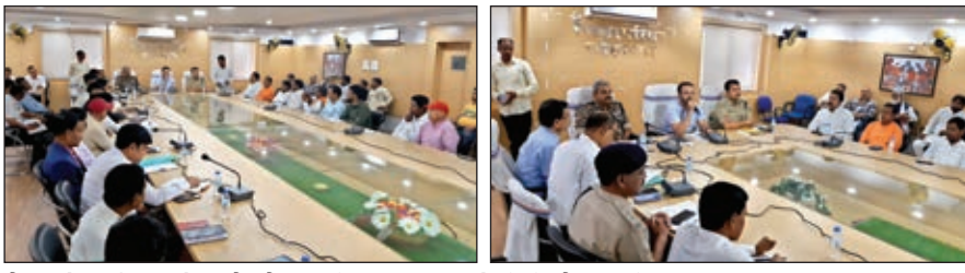
बैठक में उपस्थित लोग और बैठक की अध्यक्षता करते डीसी और एसपी।

■ उपायुक्त की अध्यक्षता में जिला स्तरीय शांति समिति की बैठक