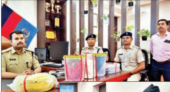
जानकारी देते एसपी।

लोहरदगा। जिले के सदर थाना पुलिस को भारी विस्फोटक के साथ चार लोगों को गिरफ्तारी करने में सफलता मिली है। गुप्ता सूचना के आधार पर सदर थाना क्षेत्र के रामपुर गांव से पुलिस टीम ने अलग-अलग ठिकानों से छापामारी कर भारी मात्रा में अवैध विस्फोटक पदार्थ जब्त किया।