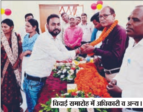
विदाई समारोह में अधिकारी व अन्य।

सीओ ने बीडीओ का भी लिया प्रभार विदाई समारोह में एक दूसरे से जुदा होने का गम छलक रहा था