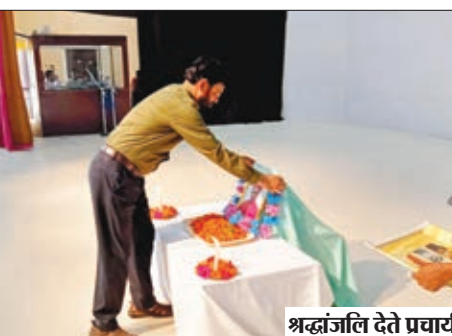
श्रद्धांजलि देते प्रचार्य।