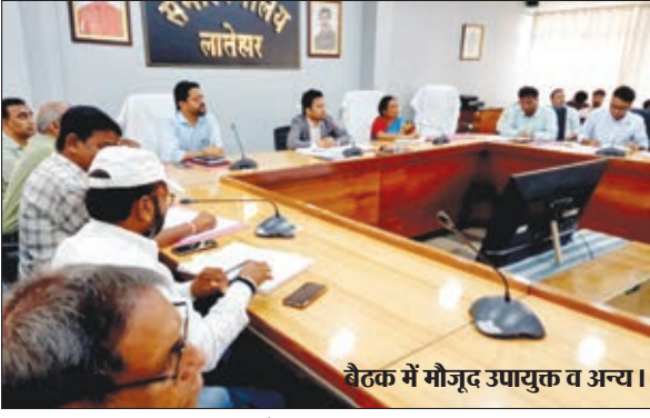
बैठक में मौजूद उपायुक्त व अन्य।

उपायुक्त ने सोशल मीडिया पर कड़ी निगरानी रखने का निर्देश दिया।