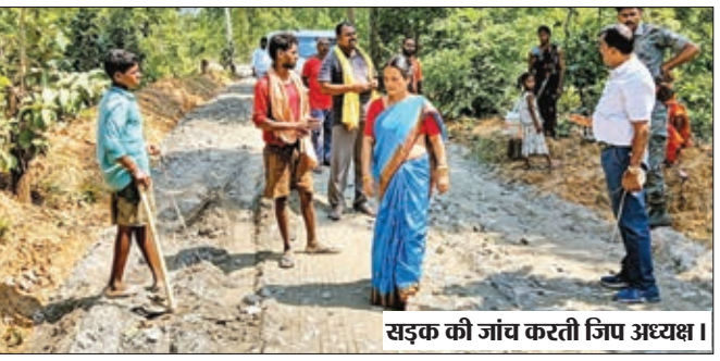
सड़क की जांच करती जिप अध्यक्ष।