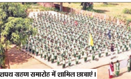
शपथ ग्रहण समारोह में शामिल छात्राएं।