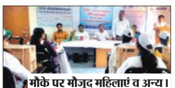
मौके पर मौजूद महिलाएं व अन्य।

लातेहार। लातेहार में दुबेद कोल माइंस (डीवीसी) ने परियोजना प्रभावित क्षेत्रों में महिलाओं को सशक्त बनाने के लिए कॉर्पोरेट सामाजिक जिम्मेदारी (सीएसआर) पहल शुरू की है। इस प्रयास के हिस्से के रूप में, कंपनी ने स्वयं सहायता समूहों (एसएचजी) की महिलाओं को सिलाई मशीन प्रदान करने में कोशल विकास प्रशिक्षण प्रदान करने के लिए ग्रामीण स्वरोजगार संस्थान (आरएसईटीआई), लातेहार के साथ साझेदारी की है। 30-दिवसीय आवासीय प्रशिक्षण कार्यक्रम को सफलतापूर्वक पूरा करने के बाद, 20 एसएचजी सदस्य अब अपनी उद्यमशीलता की यात्रा शुरू करने के लिए सिलाई मशीन प्राप्त करने के लिए तैयार हैं। कार्यक्रम के मुख्य अतिथि डीपीओ लातेहार थे, इस कार्यक्रम में डीपीएम एचएसएलपीएस के साथ आरसेटी के निदेशक और डीवीसी ट्यूबेड कोयला खदान लातेहार के वरिष्ठ अधिकारी भी उपस्थित थे।