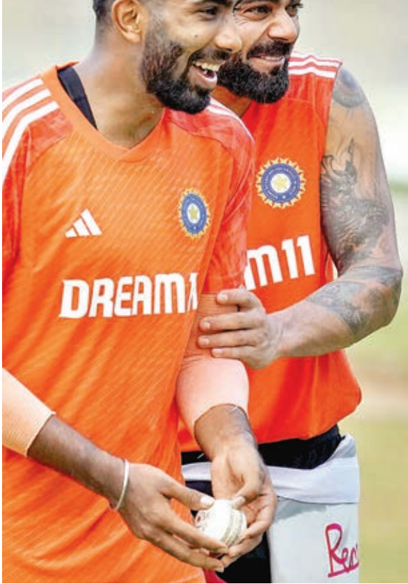
मैच का समय दोपहर 2 बजे से।

दिल्ली में चौथी बार विश्व कप का मैच खेलेगा भारत, घरेलू मैदान पर अफगानिस्तान से पहला वनडे