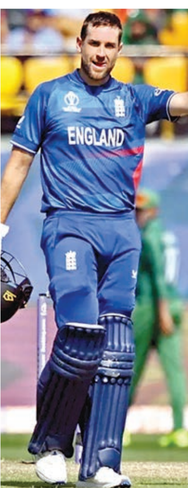
कैच दे बैठे जिससे टीम ने नौवें ओवर में 49 रन पर

धर्मशाला। सलामी बल्लेबाज डेविड मलान की आक्रमक शतकीय पारी के बाद रीस टोपले की अगुवाई में गेंदबाजों के शानदार प्रदर्शन से इंग्लैंड ने बांग्लादेश को हरया। मौजूदा चैंपियन इंग्लैंड ने विश्व कप के एकतरफा मुक़ाबले में मंगलवार को बांग्लादेश को 137 रन से शिकस्त दी। अपने पहले मैच में न्यूजीलैंड से हार का सामना करने वाली इंग्लैंड की टीम ने बल्लेबाजी का न्योता मिलने पर मलान की 107 गेंद में 140 रन के दम पर नौ विकेट पर 364 रन बनाने के बाद बांग्लादेश की पारी को 48.2 ओवर में 227 पर समेट दिया। मलान ने शतकीय पारी खेलने के साथ सलामी बल्लेबाज जॉनी बेयरस्टो (52) और पूर्व कप्तान जो स्ट (82) के साथ पहले और दूसरे विकेट के लिए शतकीय साझेदारियां कर बड़े स्कोर की नींव रखी। बांग्लादेश के लिए महेदी हसन ने 71 रन पर चार जबकि शरीफुल इस्लाम ने 75 रन पर तीन विकेट लिये। बड़े लक्ष्य का पीछे करते हुए बांग्लादेश के लिए लिटन दास (76) और विकेटकीपर मुशफिकुर रहम (51) ही इंग्लैंड के गेंदबाजों का कुछ हद तक सामना कर सके। इंग्लैंड के लिए रीस टोपले ने 43 रन पर चार जबकि क्रिस वोक्स ने दो विकेट लिए। मार्क वुड, आदिल राशीद, लियाम लिविंगस्टोन और सैम करन को एक-एक सफलता मिली बल्लेबाजी में बांग्लादेश की शुरुआत बेहद खराब रही। टोपले ने अपने शुरुआती ओवर में लगातार गेंदों पर तंजिद हसन