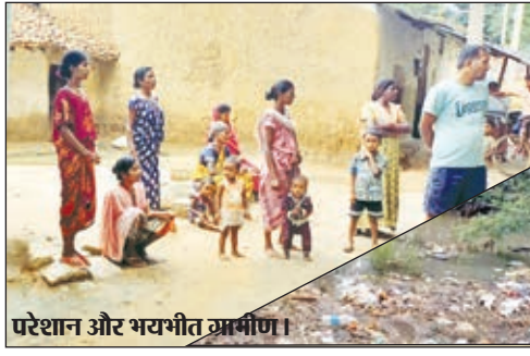
परेशान और भयभीत ग्रामीण।

फैलती जा रही है। अभी तो आलम करीब 16 लोग डायरिया की चपेट में आ चुके हैं। जिसमें कुछ लोग