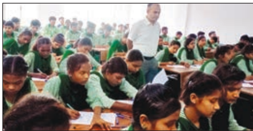
निरीक्षण के दौरान परीक्षा दे रहे बच्चों के बीच उपायुक्त।

■ नियमित टेस्ट और परीक्षा लेने को उपायुक्त ने बताया महत्वपूर्ण ■ अब विद्यार्थियों का बुप बना कर उनके शैक्षणिक गुणवत्ता में करेगा सुधार