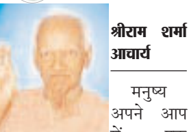
श्रीराम शर्मा आवार्य

मनुष्य अपने आप में एक परिपूर्ण इकाई है। उसमें वे समस्त शक्तियाँ और संभावनाएँ जन्मजात रूप में विद्यमान हैं, जिनके आधार पर किसी भी दिशा में पूर्णता एवं सफलता के उच्च-शिखर पर पहुँचना संभव हो सकता है।