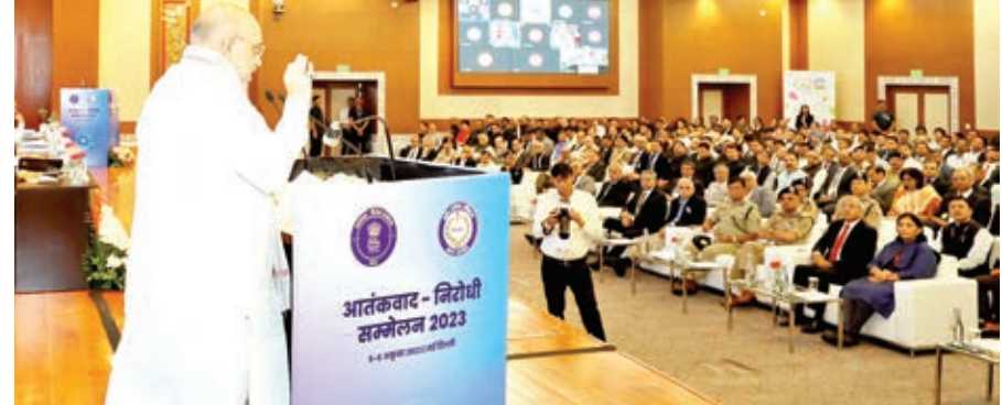
नयी दिल्ली में आतंकवाद निरोधी सम्मेलन में केंद्रीय गृह मंत्री अमित शाह।

देश को पहली महिला आदिवासी राष्ट्रपति देने का सौभाग्य भी भाजपा को मिला। आजादी के बाद दशकों तक जो दल सरकार में बैठा रहा, उसने एक ही काम किया, एक ही परिवार को चरण वंदना की।