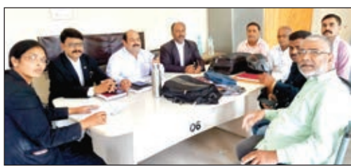
बैठक में शामिल प्रबुद्ध जन।