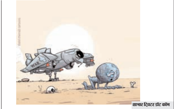
सागर दिखर उर्द काँम