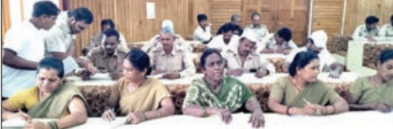
प्रतियोगिता में शामिल उद्यान के पशुपालक व कर्मी ।