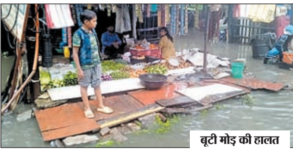
बूटी मोड़ की हालत