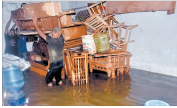
पंडरा स्थित पंचशील नगर में दुकानों में भरा पानी