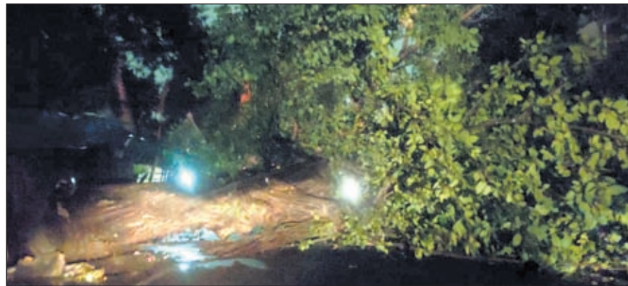
मोरहाबादी में हरिहर सिंह रोड के पास एक विशाल पेड़ गिरा