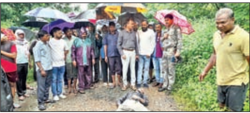
शव के साथ भदानीनगर पुलिस व स्थानीय लोग