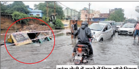
कांटा टोली में गड्ढे में गिरा आंटी रिवशा

रांची। भारी बारिश के बीच रिम्स में भर्ती मरीजों को सबसे ज्यादा परेशानी हो रही है। अस्पताल के न्यूरो सर्जरी विभाग के कॉरिडोर में भर्ती मरीजों के परिजन छता लगाकर अपने मरीजों व खुद को बारिश से बचाने की कोशिश कर रहे थे। फर्श में पानी भर गया था। इस कारण मरीज अपने बिस्तरों को इधर से उधर कर भींगने से बचाने की कोशिश में जुटे थे। परिजन अपने मरीज को चटाई, प्लास्टिक व चादर से ढंकरकर बारिश से बचाने की जद्दोजहद में लगे हुए थे। वहीं रिम्स के फिजियोथेरेपी विभाग में बारिश के बाद पानी भर गया था।