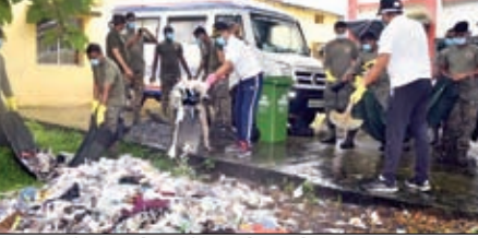
स्वक्षता अभियान में शामिल कोबरा के जवान व अन्य