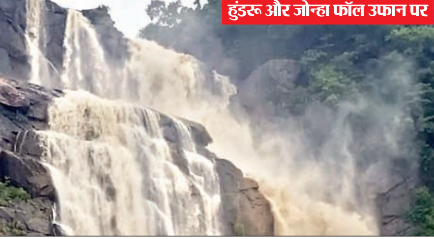
हुंडरू और जोन्हा फॉल उफान पर

अनगड़ा। शनिवार की रात से लगातार हो रही बारिश से गेतलसूद डैम का जलस्तर 30 फीट को पार कर गया है। खतरों का निशान महज चार फीट ऊपर है। ऐसे ही बारिश होती रही तो डैम का रेंडियल गेट को खोलकर पानी को बहाने की नौबत आ जाएगी। फिलहाल सिकिंदरी हाइडल को बिजली उत्पादन के लिए उसके मांग के अनुयाय नहर से पानी दिया जा रहा है। झर बारिश से हुंडरू, जोन्हा और सीता फॉल भी पूरे उफान पर है। रविवार को बारिश होने के वावजूद पर्यटकों की भीड़ हुंडरू, जोन्हा और गेतलसूद डैम में देखी गई। फॉल का विहंगम नजारा पर्यटकों को आकर्षित कर रहा है।