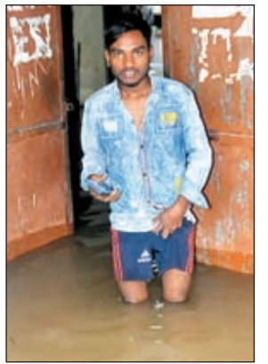
पंचशील नगर में घुटने भर पानी

के जिले हैं। मौसम केंद्र ने चेतावनी दी है कि इस दौरान गर्जन और वज्रपात से बचने की जरूरत है।