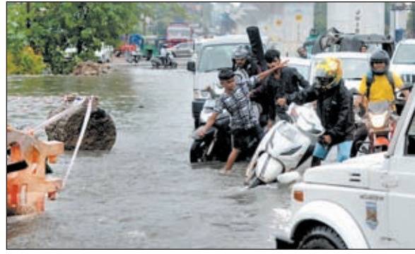
झील में तब्दील सड़कों पर गिरते-संभलते दिखे वाहन चालक