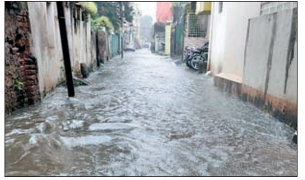
मोरहाबादी स्थित लखराज गली में एक फीट ऊपर तक बहा पानी