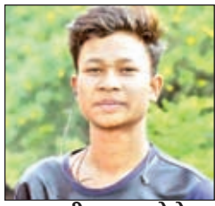
सुजल की फाइल फोटो

कि मैं तेतरिया खदान तरफ हूं थोड़ी देर में आ रहे हूँ। देर रात तक घर नहीं आने पर परिजनों सहित आसपास के लोगों द्वारा उरु स्थान पर पहुंच खोजबीन करने पर तेतरिया खुली खदान के समीप होंडा साइन बाइक जेएच 02 एएम 7326, हेल्मेट, चप्पल, मोबाइल