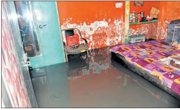
कचहरी रोड के टिबर गली में घरों के बेडरूम में घुसा बारिश का गंदा पानी