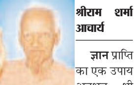
श्रीराम शर्मा आचार्य

शिक्षा ले सकता है। अपना सुधार कर अपने को ठीक मार्ग पर चलाकर ठीक लक्ष्य पर पहुँच सकता है। तात्पर्य यह कि सत्संग-स्वाध्याय, चिंतन-मनन और अनुभव के आधार पर व्यक्ति को सद्ज्ञान प्राप्त करने का निरंतर प्रयास करते ही रहना चाहिए। बिना ज्ञान के न तो जीवन सफल होता है और न सार्थक। अज्ञानावस्था में भौतिक और आत्मिक दोनों जीवनों का नाश हो जाता है। इसलिए इस अंधकार से निकलकर ज्ञान रूपी प्रकाश की ओर बढ़ते ही रहना चाहिए। इसमें प्रमाद अथवा आलस्य करने का अर्थ है-अपने सूर दुर्लभ मानव-जीवन को नष्ट कर देना, जिसमें भौतिक उन्नति तो की ही जा सकती है, आत्मप्रकाश भी पाया जा सकता है।