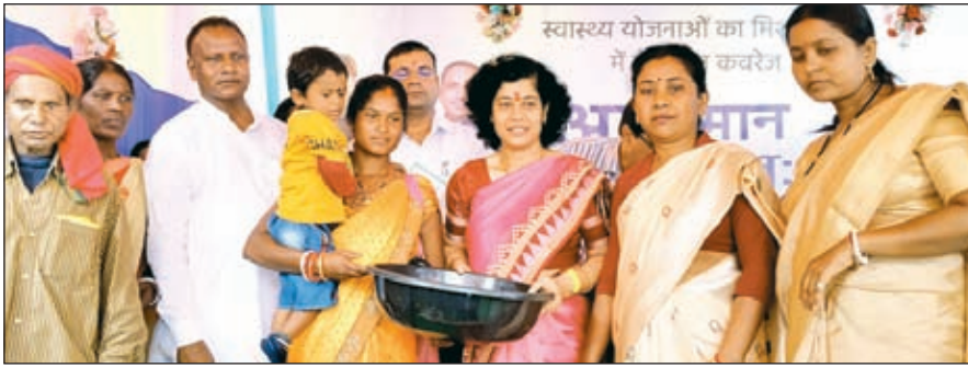
लाभुक को किट प्रदान करतीं संयुक्त सचिव आराधना पटनायक।

ओरमांडी। केंद्रीय स्वास्थ्य मंत्रालय के संयुक्त सचिव आराधना पटनायक शुक्रवार ओरमांडी पहुंचीं। उन्होंने आयुष्मान भव: अभियान के तहत सीएचसी ओरमांडी में लगी स्वास्थ्य मेला का जाएजा भी ली। आरधना पटनायक अभियान के केंद्रीय नोडल पदाधिकारी भी हैं। उन्होंने प्रमुख अनुपमा देवी व अन्य अतिथियों के साथ कार्यक्रम का उद्घाटन की और कहा पूरे भारत में आयुष्मान भव: योजना 17 सितंबर से दो अक्टूबर तक चलाए जा रहे हैं। 13 सितंबर को राष्ट्रपति द्रौपदी मुर्मु द्वारा राष्ट्रीय स्तर में इसका शुभारंभ किया गया है। वहीं सभी राज्यों में