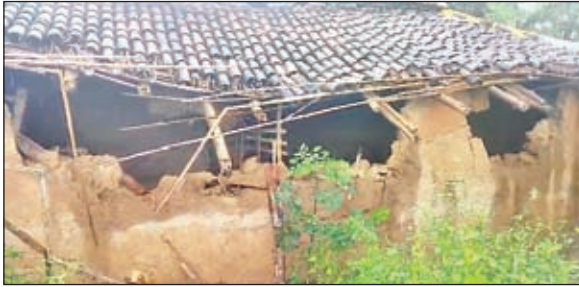
राहे में हाथी द्वारा गिराया गया घर।