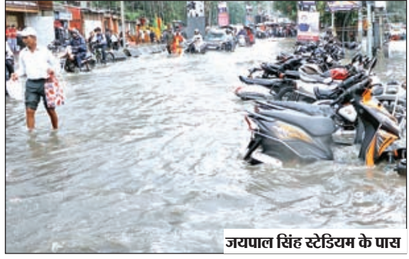
जयपाल सिंह स्टेडियम के पास