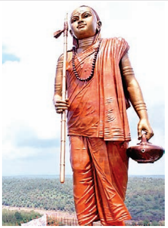
मध्य प्रदेश के नर्मदा किनारे ऑकारेश्वर में आदि गुरु शंकराचार्य की 2100 करोड़ की लागत से 108 फीट ऊंची प्रतिमा का भव्य अनावरण सीएम शिवराज सिंह चौहान ने किया।

नयी दिल्ली। दिल्ली विश्वविद्यालय छात्र संघ (डूस्) चुनाव तीन साल बाद शुक्रवार को होंगे। इन चुनावों को लेकर पहली बार के मतदाताओं में खासा उत्साह देखा जा रहा है। वहीं, सुरक्षा के भी पुख्ता इंतजाम किए गए हैं। विश्वविद्यालय प्रशासन के मुताबिक, सुबह की पाली के विद्यार्थी सुबह साढ़े आठ बजे से दोपहर एक बजे तक मतदान कर सकेंगे जबकि शाम की पाली के विद्यार्थी दोपहर तीन से शाम साढ़े सात बजे तक वोट डाल सकेंगे। मतगणना शनिवार को होगी।