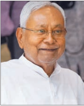
महिलाओं को भी आरक्षण मिलना चाहिए। हम तो चाहते हैं कि जल्दी से जल्दी

पटना (हि.स.)। मुख्यमंत्री नीतीश कुमार ने बिहार के भूतपूर्व मुख्यमंत्री स्व. भोला पासवान शास्त्री की जयंती पर गुरुवार को उनके तैलचित्र पर माल्यार्पण कर श्रद्धांजलि अर्पित की। पत्रकारों से बातचीत में उन्होंने कहा कि हमलोग तो शुरू से चाहते थे कि महिला आरक्षण बिल पास हो। यह लोकसभा से पास हो गया है। अब महिला आरक्षण को जल्दी से लागू करना चाहिए। ये लोग जनगणना नहीं करवाए हैं, इसलिए इसमें देरी होगी। सीएम ने कहा कि इस काम को और तेजी से करना चाहिए। जिस तरह से अनुसूचित जाति एवं अनुसूचित जनजाति वर्ग की महिलाओं को आरक्षण दिया गया है, उसी तरह से इसमें पिछड़ा और अति पिछड़ा वर्ग की