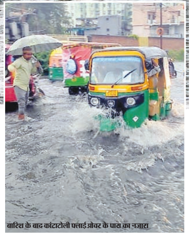
बारिश के बाद कांटाटोली फ्लाईओवर के पास का नजारा

लेन, हरमू रोड, कांके रोड, (कृषि भवन) के पास, हरमू कॉलोनी, नीचे कांटा टोली, हिंदपीढ़ी खेत मुहल्ला, नेजाम नगर, मोजाहिद नगर, करम चौक, विधाननगर, पुराना अरगोड़ा, बली बगीचा, पुंदाग, दीपाटोली आदि क्षेत्र के लोग भी जलजमाव से परेशान रहे। शहर में बने बेतरतीब ड्रेनेज सिस्टम की वजह से हलकी बारिश में भी स्थिति नारकीय रही।