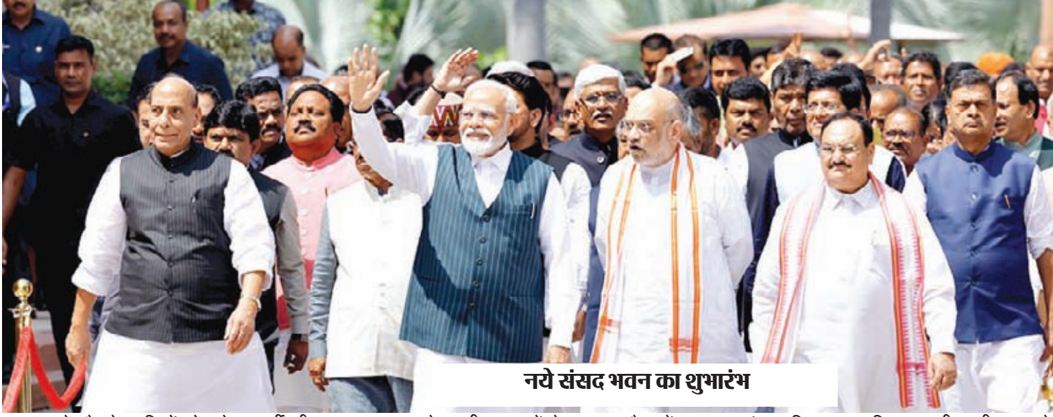
नये संसद भवन का शुभारंभ

आपको और देशवासियों को गणेश चतुर्थी की अनेक-अनेक शुभकामनाएं। आज नये संसद भवन में हम सब मिलकर के नये भविष्य का श्रीगणेश करने जा रहे हैं। आज हम यहां विकसित भारत का संकल्प दोहराना फिर एक बार संकल्पबद्ध होना और उसको परिपूर्ण करने के लिए जी-जान से जुटने के इरादे से नए भवन की तरफ प्रस्थान कर रहे हैं। सम्माननीय सभागृह, ये भवन और उसमें भी ये सेंट्रल हॉल एक