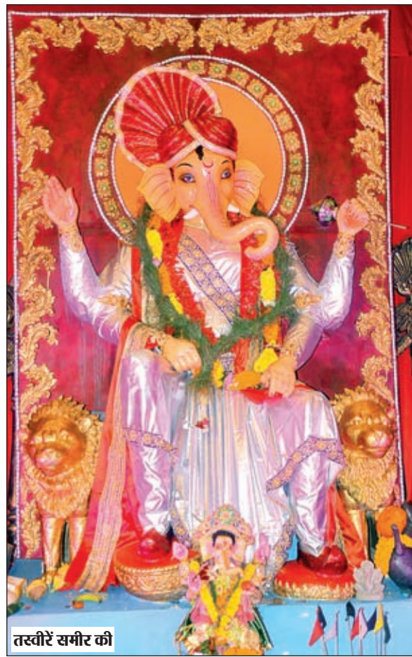
तस्वीरें सभरी की