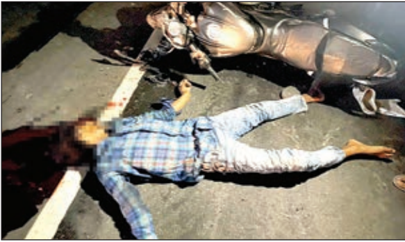
सड़क में खड़ी ट्रक और ट्रकर के बाद बाइक सहित गिरे युवक।

आजकल में सवार होकर रामगढ़ गए थे। लौटने के दौरान बाइक सड़क पर खड़ी ट्रक सीसी-04एनएच-5226 से जा टकराई। ट्रकर के