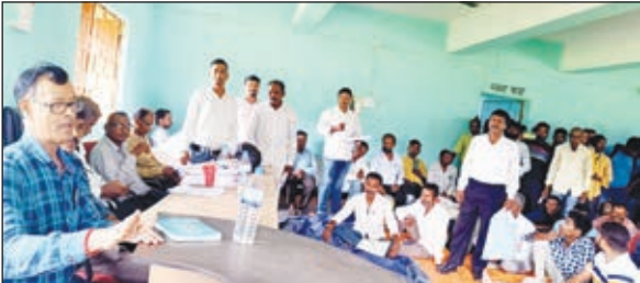
राहे में जमीन अधिग्रहण आम सभा में हंगामा करते ग्रामीण।

राहे। राहे-हाहे सड़क निर्माण में जमीन अधिग्रहण करने को लेकर बुधवार को राहे पंचायत सचिवालय आम सभा का आयोजन किया गया। भू-अर्जन विभाग और पथ निर्माण विभाग के अधिकारियों के साथ जमीन रयत और ग्रामीणों की आम सभा हंगामा के साथ संपन्न हुई। भू-अर्जन विभाग के अधिकारियों ने बताया कि राहे -हाहे सड़क के चौड़ीकरण में राहे अंचल के पांच गांव के 24 एकड़ जमीन का अधिग्रहण किया जाना है। राहे,