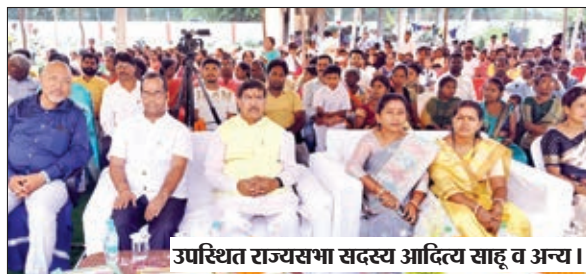
उपस्थित राज्यसभा सदस्य आदित्य साहू व अन्य।

ओरमांडी। शिक्षा का उद्देश्य चरित्र निर्माण होना चाहिए। प्रखंड के सुदूरवर्ती क्षेत्र में स्थित झारखंड पब्लिक स्कूल मनातु में बुधवार को आयोजित 18वें स्थापना दिवस समारोह में वतौर मुख्य अतिथि राज्यसभा सांसद आदित्य साहू ने उक्त बातें कही। कार्यक्रम में ग्रामीण क्षेत्र के बच्चों द्वारा सांस्कृतिक कार्यक्रम प्रस्तुत किया गया। अलग-अलग ग्रुप में छात्राओं ने संधाली, अरामिया व झारखंड सहित विभिन्न प्रदेश के लोक नृत्य प्रस्तुत किए। वहीं छात्रों द्वारा हिन्दी बॉलीवुड आदि डांस प्रस्तुत किया गए। इसके अलावे छात्राओं द्वारा बेटियों पर हो रही अत्याचार, एचिड पेटेक, घरेलू हिंसा पर आधारित मार्मिक नाट्य प्रस्तुती देख उपस्थित