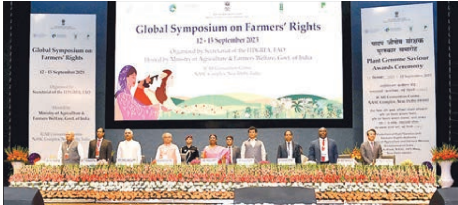
किसानों के अधिकारों पर आयोजित वैश्विक संगोष्ठी में राष्ट्रपति द्रौपदी मुर्मू एवं अन्य।

राष्ट्रपति ने कहा कि कृषि अनुसंधान और प्रौद्योगिकी विकास