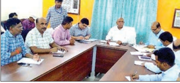
सरकारी उपक्रम संबंधी समिति संग बैठक करते अधिकारी।

धनबाद। झारखंड विधानसभा की सरकारी उपक्रमों संबंधी समिति ने माननीय सभापति सह जमशेदपुर पूर्व के विधायक श्री सरजू राय की अध्यक्षता में उप विकास आयुक्त श्री शशि प्रकाश सिंह सहित जिले के सभी विभागों के पदाधिकारियों के साथ सफ्टेड हाउस में बैठक की। बैठक के समापन के बाद माननीय सभापति ने कहा कि धनबाद में जुड़को द्वारा बन रहे वाटर ट्रीटमेंट प्लांट को समय पर पूरा करने का निर्देश दिया है। कार्य में विलंब होने से राज्य सरकार पर वित्तीय बोझ पड़ेगा। उन्होंने बताया कि जुड़को ने 2024 तक कार्य को