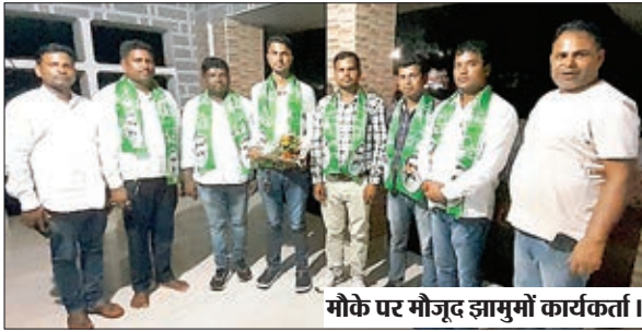
मौके पर मौजूद झामुमो कार्यकर्ता।