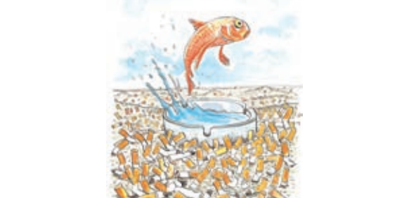
साभार कार्टून मुखर्जेट