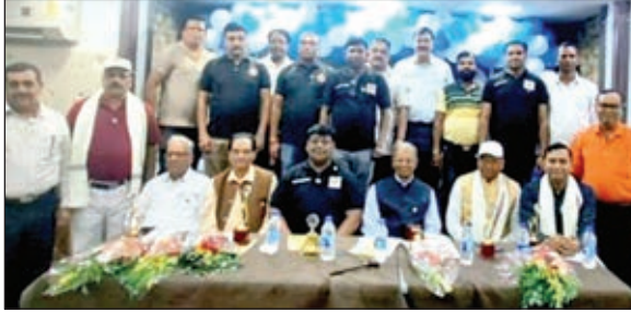
स्थापना दिवस में शामिल क्लब के सदस्य।