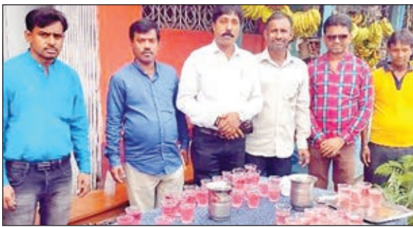
संस्था ने स्टॉल लगाकर लोगों को शख्त पिलाया।