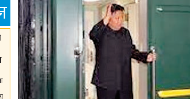
बुलेटप्रूफ ट्रेन में उतर कोरिया के तानाशाह किम जोंग उन।

बुलेटप्रूफ ट्रेन से यात्रा कर रूस पहुंचे उ. कोरिया के तानाशाह किम जोंग उन