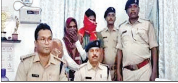
केंदुआडीह पुलिस की गिरफ्त में दोनों अपराधी।