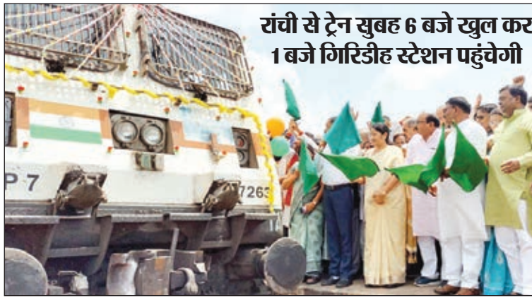
पहली विस्टाडोम कोच वाली ट्रेन को रवाना करते कोडरमा व गिरिडीह सांसद व उपस्थित अन्य।

चली सीधो ट्रेन : विस्टाडोम कोच वाली इस ट्रेन लोगों के लिए खासा आकर्षण