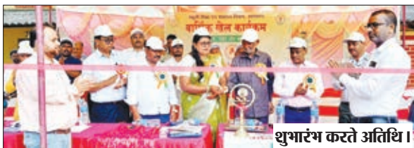
शुभारंभ करते अतिथि।