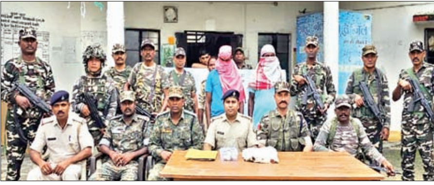
गिरफ्तार आरोपियों के साथ पुलिस।

खुंटी। अफीम की तस्करों के खिलाफ अभियान में जिले की अड़की पुलिस और एसएसबी के जवानों को सफलता मिली है। शनिवार को शाम अड़की थाना की पुलिस और एसएसबी 26वीं बटालियन की डी कंपनी ने संयुक्त रूप से वाहन चेकिंग अभियान