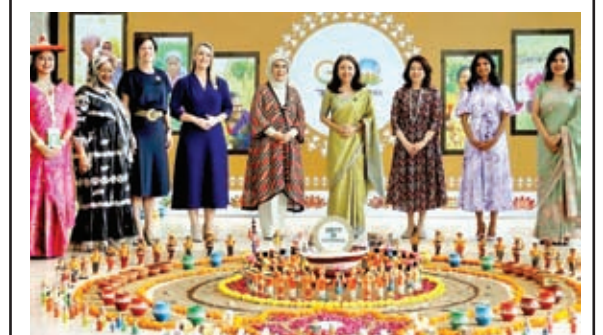
जी 20 सम्मेलन में कई राष्ट्राध्यक्षों की पत्नियां।