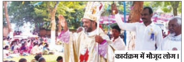
कार्यक्रम में मौजूद लोग।