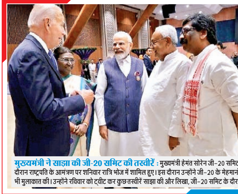
मुख्यमंत्री ने साझा की जी-20 समिट की तस्वीरें : मुख्यमंत्री हेमंत सोरेन जी-20 समिट के दौरान राष्ट्रपति के आमंत्रण पर शनिवार रात्रि भोज में शामिल हुए। इस दौरान उन्होंने जी-20 के मेहमानों से भी मुलाकात की। उन्होंने रविवार को टीवीट कर कुछ तस्वीरें साझा की और लिखा, जी-20 समिट के दौरान।

सोरेन की अनुपस्थिति में आदिवासी कल्याण मंत्री समारोह के मुख्य अतिथि थे। उन्होंने कहा कि झारखंड आंदोलन में दुर्गा सोरेन की अहम भूमिका थी। (शेष पेज 11 पर)