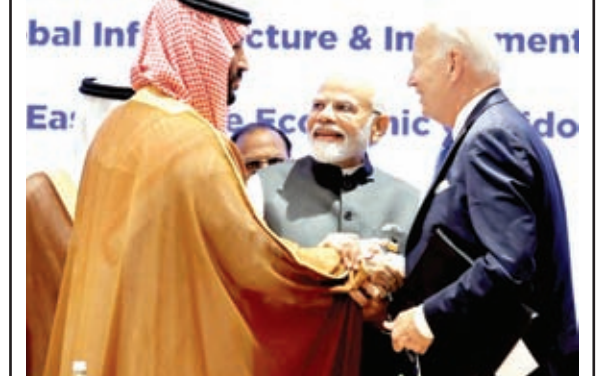
सऊदी काउन प्रिंस के साथ पीएम मोदी और अमेरिका के राष्ट्रपति।