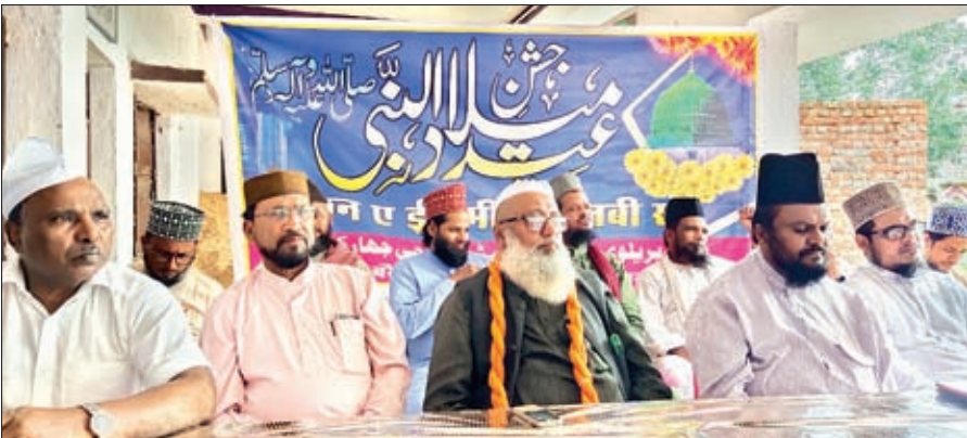
बैठक में शामिल लोग।

बैठक में सर्वसम्मति से यह निर्णय लिया गया कि चांद नजर आने के बाद इसी माह के अंत में ईद मीलादुन्नबी के अवसर पर पूरे अकीदत व एहताराम के साथ राजधानी में जुलूस मोहम्मदी