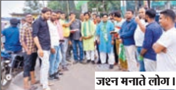
जश्न मनाते लोग।