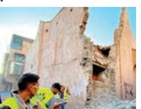
इधिल शहर के पास जमीन की सतह से 18.5 किलोमीटर की गहराई में स्थित था। भूकंप से तौरदंत और मराकेश शहरों में कई घर ढह गए। भूकंप के झटके रबात और कैसाब्लांका सहित मोरक्को

रबात। मोरक्को में शुक्रवार रात आए भीषण भूकंप में मरने वालों की संख्या बढ़कर एक हजार के करीब हो गई है और कम से कम 672 लोग घायल हुए हैं। देश के गृह मंत्रालय ने शनिवार को यह जानकारी दी। अमेरिकी भूवैज्ञानिक सर्वेक्षण के अनुसार स्थानीय समयानुसार 23.11 बजे आये भूकंप की तीव्रता रिक्टर पैमाने पर 6.8 मापी गयी। भूकंप का केंद्र मराकेश से लगभग 70 किमी दक्षिण पश्चिम में अल हौज प्रांत के