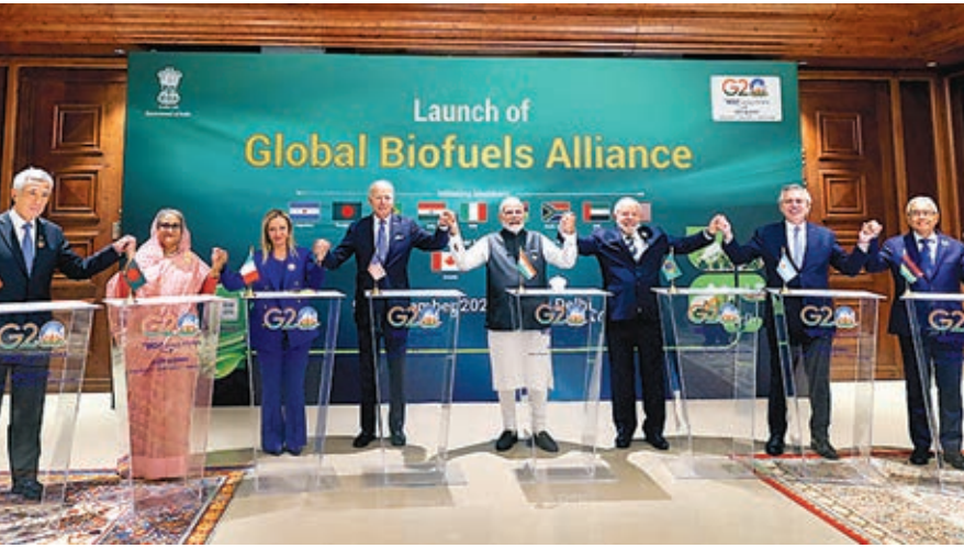
जी 20 शिखर सम्मेलन में अमेरिका के राष्ट्रपति बाइडन, प्रधानमंत्री नरेंद्र मोदी व अन्य।

प्रधानमंत्री ने कहा कि हम एक विकसित भारत के लिए एक मजबूत नींव रख रहे हैं। पीजीआईआई (वैश्विक बुनियादी ढांचे और निवेश के लिए साझेदारी) के माध्यम से, हम ग्लोबल साउथ देशों में बुनियादी ढांचे के अंतर को भरने में महत्वपूर्ण भूमिका निभा सकते हैं। भारत कनेक्टिविटी को क्षेत्रीय सीमाओं तक सीमित नहीं करता है। हमारा विश्वास है कि कनेक्टिविटी आपसी विश्वास को मजबूत करने में महत्वपूर्ण भूमिका निभा सकती है। ग्लोबल साउथ शब्द का इस्तेमाल एशिया, अफ्रीका और