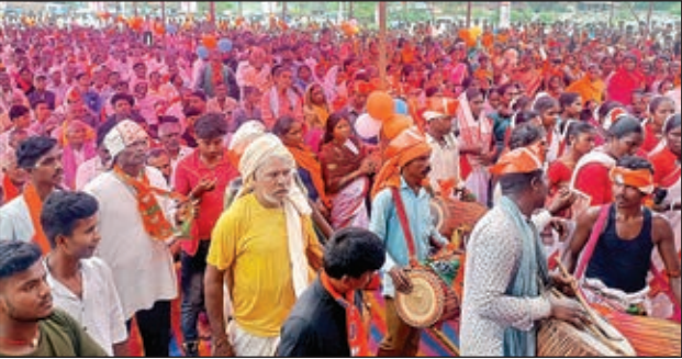
जनक्रोध सभा में उपस्थित लोग