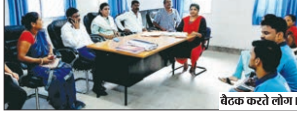
बैठक करते लोग।