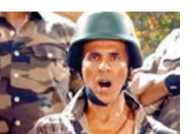
वेलकम 3 फिल्म का पोस्टर। अभिनेता ने पोस्ट के साथ एक क्लिप भी साझा किया है, जिसमें कलाकारों की टोली नजर आ रही है।

मुंबई। बॉलीवुड अभिनेता अक्षय कुमार ने अपने जन्म दिन पर वेलकम 3 फिल्म की घोषणा की, जिसका निर्देशन अहमद खान करेंगे। अभिनेता ने एक्स पर एक पोस्ट में कहा कि खुद को और आप सभी को शनिवार को जन्म दिन का उपहार दिया है। अगर आप इसे पसंद करते हैं और धन्यवाद देते हैं, तो मैं कहीं वेलकम(3)