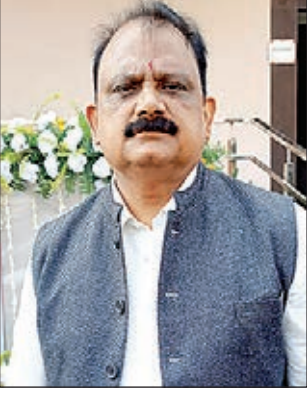
मंत्री मिथिलेश कुमार ठाकुर

गढ़वा। गढ़वा में लगभग 56 करोड़ रुपए की लागत से 10 जर्जर सड़कों का सुदृढ़ीकरण कार्य किया जाएगा। ग्रामीण कार्य विभाग झारखंड सरकार ने इसकी स्वीकृति प्रदान कर दी है। शीघ्र ही इन सड़कों का सुदृढ़ीकरण कार्य पूर्ण कर जनता को समर्पित किया जाएगा। जानकारी देते हुए गढ़वा विधायक झारखंड सरकार के पेयजल एवं स्वच्छता मंत्री मिथिलेश कुमार ठाकुर ने बताया कि राज्य सरकार द्वारा सभी सड़कों का सुदृढ़ीकरण कार्य किया जा रहा है। इन सड़कों में 12 करोड़, 71 लाख, तीन हजार, 400 रुपए की लागत से 21.75 किलोमीटर लंबी सड़क रंका प्रखंड में एनएच 343 सिकरवाहा से जोलांग (बहाहरा स्कूल) तक पथ का सुदृढ़ीकरण कार्य, रंका-खपरो मुख्य पथ से सेवाडीह मुख्य पथ वाया छात्रावास कार्य, 14 रमशान घाट तक पथ का सुदृढ़ीकरण कार्य, 13 करोड़, 92 लाख, 69 हजार,