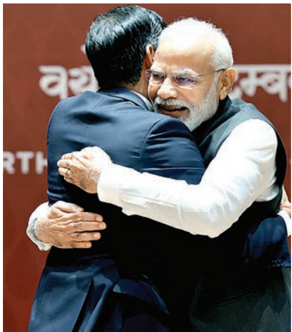
ब्रिटेन के प्रधानमंत्री ऋषि सुनक से गले मिलते प्रधानमंत्री नरेंद्र मोदी।

उन्होंने कहा कि आने वाले समय में यह भारत, पश्चिम एशिया और यूरोप के आर्थिक एकीकरण का प्रभावी माध्यम बनेगा। यह कॉरिडोर पूरी दुनिया की कनेक्टिविटी और सतत विकास को एक नई दिशा देगा। मोदी ने कहा कि यह पूरी दुनिया के लिए सतत विकास को बढ़ावा देगा। उन्होंने इस मौके पर यह भी कहा कि मजबूत कनेक्टिविटी और बुनियादी ढांचा मानवता के लिए बुनियादी आधार है तथा भारत ने हमेशा इस पर जोर दिया है।