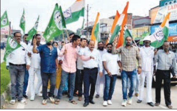
रातू में जीत का जश्न मनाते झामुमो और कांग्रेस कार्यकर्ता ।