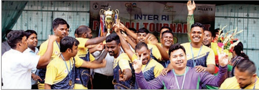
ट्रॉफी के साथ विजेता टीम।