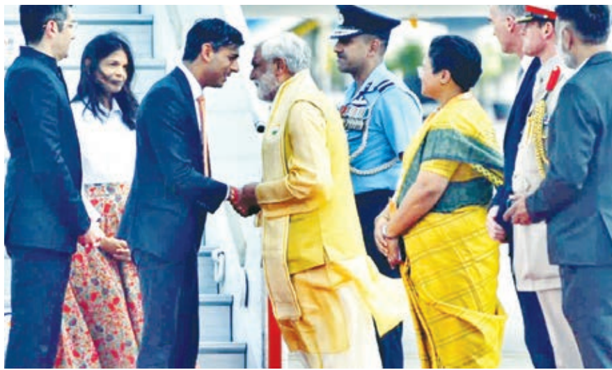
दिल्ली हवाई अड्डे पर ब्रिटेन के प्रधानमंत्री ऋषि सुनक का स्वागत करते केंद्रीय मंत्री अश्विनी चौबे।

लंदन। ब्रिटेन के प्रधानमंत्री ऋषि सुनक ने भारत का दामाद बताए जाने के संदर्भ का हवाला देते हुए मजाकिया लहजे में कहा कि जी20 नेताओं के शिखर सम्मेलन के लिए नयी दिल्ली का उनका दौरा खास है। ब्रिटेन के प्रधानमंत्री बनने वाले भारतीय मूल के पहले व्यक्ति सुनक की शादी अश्वता मूर्ति से हुई है। नयी दिल्ली की अपनी उड़ान में पत्रकारों से बातचीत में सुनक (43) ने कहा कि वह भारत आने को लेकर उत्साहित हैं। एक ऐसा देश जो मेरे लिए बहुत करीब और प्रिय है। इस यात्रा में सुनक के साथ उनकी पत्नी और इंग्लैंड के सह-संस्थापक नारायण मूर्ति की बेटी भी शामिल हैं। सुनक का शिखर सम्मेलन के इतर प्रधानमंत्री नरेन्द्र मोदी के साथ द्विपक्षीय वार्ता का कार्यक्रम है। सुनक ने तीन दिवसीय दौर के लिए रवाना होने से पहले एक्स पर पोस्ट में कहा कि मैं स्पष्ट फोकस के साथ जी20 शिखर सम्मेलन में हिस्सा लेने जा रहा हूँ। वैश्विक अर्थव्यवस्था को स्थिर करना है। अंतरराष्ट्रीय संबंध बनाना है। सबसे कमजोर लोगों का