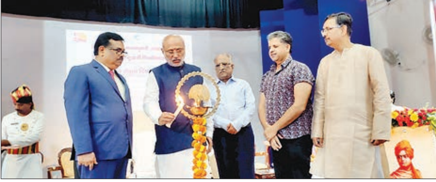
डीएसपीएमयू में विश्व बंधुत्व दिवस पर आयोजित कार्यक्रम का उद्घाटन करते राज्यपाल।

उन्होंने कहा कि यहां की संस्कृति के जड़ में हिंदुत्व है तथा वसुधैव कुटुंबकम यानी संपूर्ण विश्व को अपने परिवार के रूप में मानने की हमारी परंपरा रही है। उन्होंने स्वामी विवेकानंद की चर्चा करते हुए कहा कि ऐसे विरले व्यक्तित्व धरती पर कभी-कभी ही अवतरित होते हैं। उन्हें अपने हिंदू होने का गर्व था और उन्होंने यह कहा कि बी रेडी टू फाइंड फॉर योर