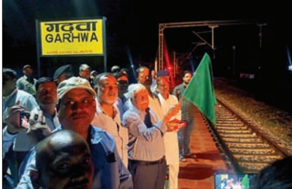
हरी झंडी दिखाकर रवाना करते सांसद