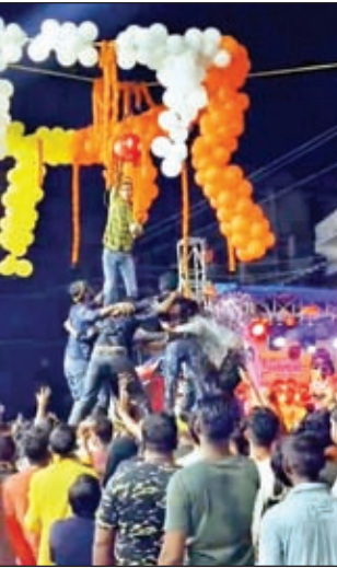
मटका फोड़ते युवक