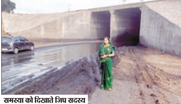
समस्या को दिखाते जिप सदस्य