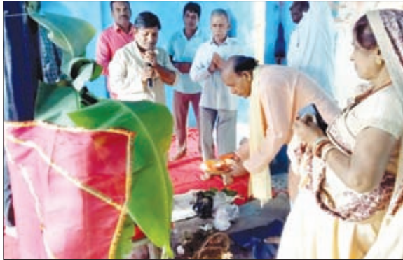
पूजा-अर्चना करते लोग।

खबर मन्त्र संवाददाता कैरो। प्रखंड मुख्यालय स्थित श्री