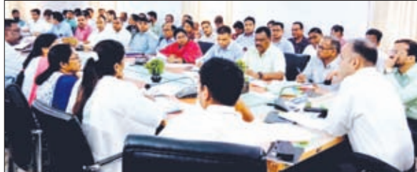
बैठक में शामिल उपायुक्त व अन्य पदाधिकारी।

गुमला। उपायुक्त कर्ण सत्यार्थी की अध्यक्षता में बुधवार को समाहरणालय सभागार में जिला समन्वय समिति की बैठक हुई। जिसमें उप विकास आयुक्त, एसडीओ सदर,अपर समाहता, परियोजना निदेशक आईटीडीए समेत सभी प्रखंडों के प्रखंड विकास पदाधिकारी, अंचल अधिकारी एवं विभागीय पदाधिकारी बैठक में उपस्थित थे। बैठक के दौरान जिले में प्रारंभ हुए नई गतिविधि शिक्षा कर भेंट के संबंध में परिचर्चा की गई एवं आगे के कार्य योजना के संबंध में उपायुक्त ने अधिकारियों को आवश्यक दिशा निर्देश दिया। उपायुक्त ने सभी संबंधित अधिकारियों को जिले के 110 हाई स्कूल से टैग किया था। जिसपर उपायुक्त ने अधिकारियों से विद्यालय