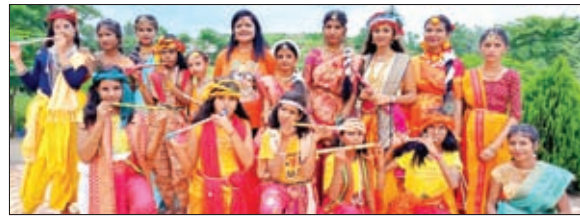
राधा-कृष्ण के रूप में सज्जी छात्राएं।

घाघरा। घाघरा प्रखंड के विभिन्न विद्यालयों में बुधवार को श्री कृष्ण जन्माष्टमी पर्व धूमधाम से मनाया गया। इस क्रम में सर्वप्रथम सांलिटेयर एजुकेशनल एकेडमी मकरा घाघरा में कक्षा नर्सरी से नवी तक के विद्यार्थियों ने राधा कृष्ण के स्वरूप का चित्रण किया। साथ ही छात्र-छात्राओं ने कृष्ण जन्म की घटनाओं पर आधारित कालिया नाग के मर्दन