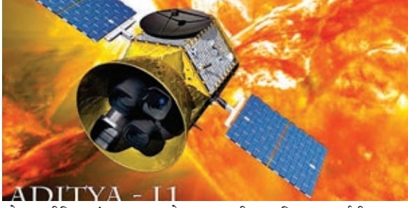
सोशल मीडिया मंच एक्स पर पोस्ट किया कि पृथ्वी की कक्षा से संबंधित दूसरी प्रक्रिया (ईबीएन#2) आईएसटीआरएसी, बंगलुरु से