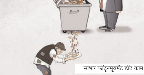
साभार कार्टूनमूवमेंट डॉट काम