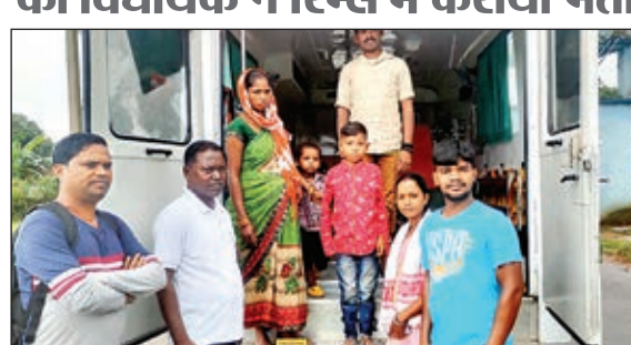
एंबुलेंस से हृदय रोगी बच्चे को रिस्स ले जाते उसके माता-पिता।