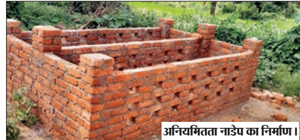
अनियमितता नाडेप का निर्माण।

चंद्रवा। पेयजल एवं स्वच्छता विभाग द्वारा कचरा निस्तारण को लेकर बनने वाले नाडेप निर्माण में भारी अनियमित बरते जाने का मामला प्रकाश में आया है। स्थानीय लोगों का आरोप है कि नियमों को ताक पर रखते हुए संबंधित पंचायत प्रतिनिधि बिजोलियों की मिली भगत से सरकारी राशि के बंदर बांट करने में जुट गए हैं। नाडेप निर्माण में चंद्रवा किस्म के ईट का प्रयोग घड़ल्ले से किया जा रहा है, इतना ही नहीं सूत्रों की माने तो महज 20000 रूपए की लागत से बनने वाले एक नाडेप का निर्माण भी एक बड़े नेता के दबाव में जिला के संवेदकों को दे दिया गया है। जानकारी के अनुसार प्रखंड के 17 पंचायत में जनसंख्या एवं पंचायत के भौगोलिक स्थिति को देखते हुए नाडेप निर्माण के लिए पेयजल एवं