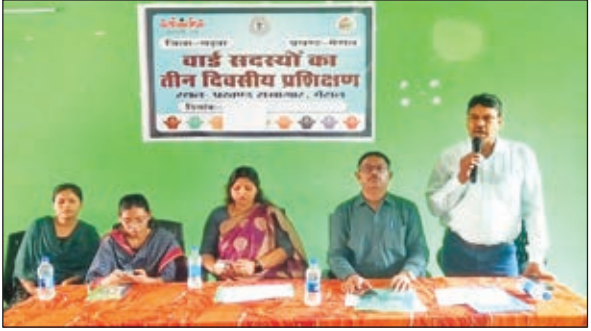
संबोधित करते अतिथि