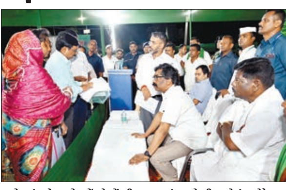
साहेबगंज के बरहेट में लोगों की समस्याएं सुनते सीएम हेमंत सोरेन।