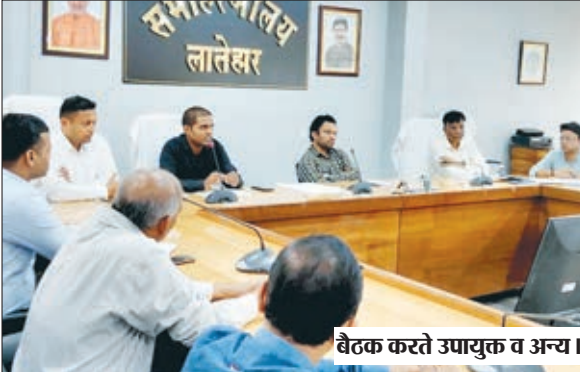
बैठक करते उपायुक्त व अन्य।