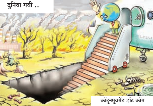
कॉन्सम्यूमेंट डाट कॉम