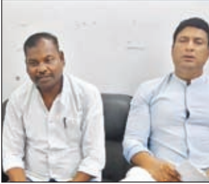
खबर मन्त्र संवाददाता