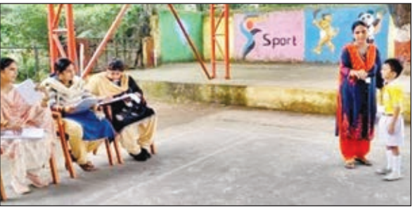
झरिया में कविता का वाचन करता बच्चा।