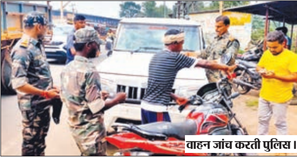
वाहन जांच करती पुलिस।