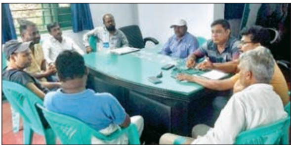
प्रबंधन संग वार्ता करते लोग।