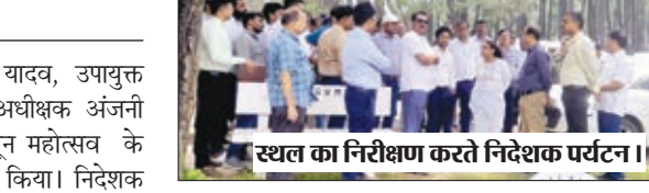
स्थल का निरीक्षण करते निदेशक पर्यटन।

लातेहार। निदेशक पर्यटन अंजली यादव, उपायुक्त लातेहार हिमांशु मोहन एवं पुलिस अधीक्षक अंजनी अंजन ने नेतरहाट में नेतरहाट मानसून महोत्सव के आयोजन को लेकर स्थल निरीक्षण किया। निदेशक पर्यटन ने बताया कि पर्यटन निदेशालय झारखण्ड के द्वारा नेतरहाट में 22 सितम्बर से 22 अक्टूबर 2023 तक नेतरहाट मानसून महोत्सव का आयोजन किया जाएगा। ज्ञात हो कि मुख्यमंत्री हेमन्त सोरेन के द्वारा 22 सितम्बर को मानसून महोत्सव का शुभारम्भ किया जाएगा। मानसून महोत्सव के तहत सांस्कृतिक कार्यक्रम, फिल्म स्क्रीनिंग, हैंडिक्राफ्ट मेला, साईक्लार्थन समेत अन्य कार्यक्रम आयोजित किये जावेंगे। निदेशक पर्यटन, उपायुक्त लातेहार एवं पुलिस अधीक्षक ने नेतरहाट मानसून महोत्सव के आयोजन को लेकर होलन प्रभात विहार, नेतरहाट लेक के पास निर्मित आराम थिएटर, कोयल व्यू पाइंट, नेतरहाट विद्यालय के मैदान एवं टूरिस्ट