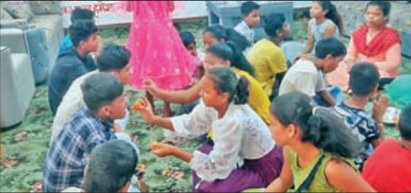
मुक वधिर आवासीय विद्यालय में रक्षाबंधन पर भाइयों को मिठाई खिलाई।

गुमला। भाई-बहनों के अटूट रिश्ते का पर्व राखी जिले में धूमधाम के साथ संपन्न हो गया। बहनों ने भाईयों के हाथों में रक्षा सूत्र बांधकर अपनी रक्षा की कामना की। गुरवार की अहले सुबह स्नान कर बहनें विभिन्न मंदिरों में जाकर पूजा अर्चना की। जिसके बाद भाईयों की कलाई राखी से सजाई। बहनें भाईयों का सबसे पहले तिलक की व आरती उतारी कर उनके हाथों में रक्षा सूत्र बांधी। राखी बांधने के साथ बहनों ने भाईयों का मुंह मिठा भी कराया। महापवित्रता और भाई बहनों के मधुर रिश्ते के इस पर्व की खुशी भाई-बहन दोनों के चेहरे पर झलकती नजर आई। राखी पर्व