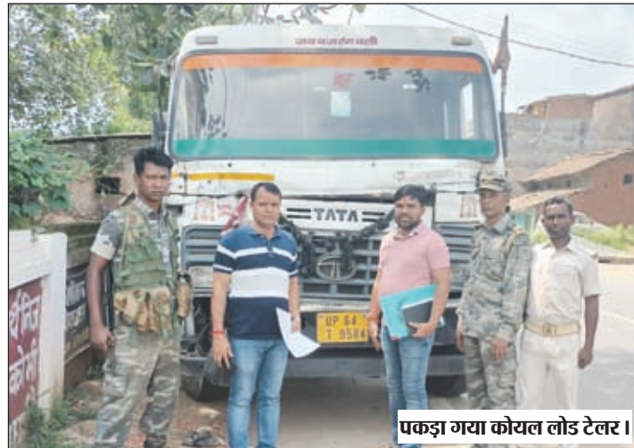
पकड़ा गया कोयला लोड टेलर।