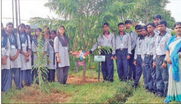
पेड़ में रक्षा सूत्र बांधते विद्यार्थी