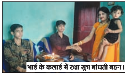
भाई के कलाई में रक्षा सूत्र बांधती बहन।

रक्षाबंधन पर लड्डू और पेड़े खुब बिके। इनके दुकानों में भारी भीड़ दिखी। इसके अलावे अन्य सुखी मिठाइयों की विक्री भी जमकर हुई।