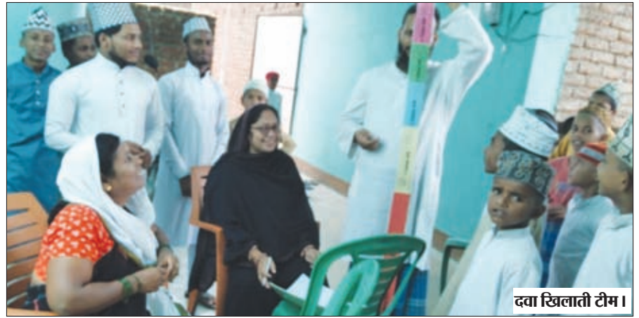
दवा खिलाती टीम।