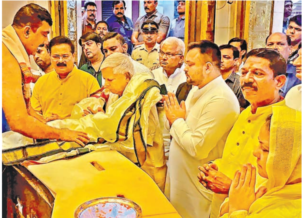
मुंबई के सिद्धि विनायक मंदिर में गुरुवार को पूजा करते बिहार के पूर्व सीएम लालू प्रसाद, तेजस्वी यादव व अन्य।

इंफाल। मणिपुर में गोलीबारी की घटना में घायल हुए दो लोगों ने पिछले 12 घंटों के दौरान दम तोड़ दिया। इसके साथ ही बृहस्पतिवार सुबह बिष्णुपुर जिले के खोईरेंटक तलहटी और चुराचांदपुर जिले के चिंगफेई और खोसाबुंग इलाकों में दो समूहों के बीच भारी गोलीबारी की सूचना मिली है। अधिकारियों ने यह जानकारी दी। अधिकारियों के मुताबिक, गोलीबारी की नई घटना बुधवार शाम से कुछ घंटों की शांति के बाद हुई। उन्होंने बताया कि बुधवार की इस हिंसा में घायल हुए एक व्यक्ति की मिजोरम के रास्ते गुवाहाटी ले जाते समय मौत हो गई। अधिकारियों ने बताया कि हिंसा में घायल हुए एक अन्य व्यक्ति की बृहस्पतिवार सुबह लगभग नौ बजे चुराचांदपुर जिले के अस्पताल में मौत हो गई। उन्होंने बताया कि चिंगफेई इलाके में बुधवार शाम हुई गोलीबारी में घायल हुए पांच लोगों में से तीन को चुराचांदपुर जिला अस्पताल लाया गया था।