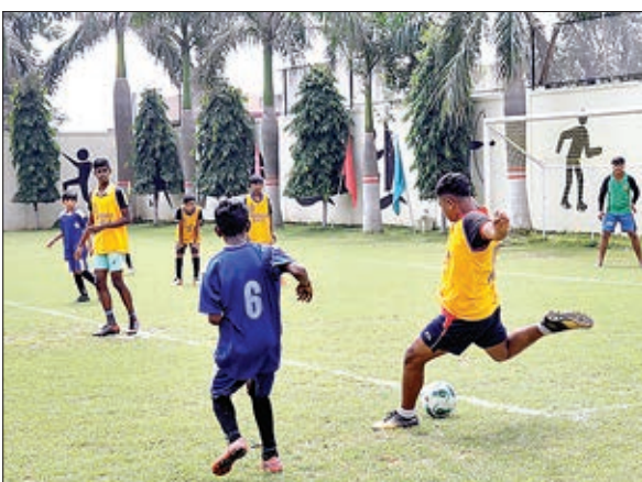
फुटबॉल खेलते बच्चे।

रांची। सरला बिरला पब्लिक स्कूल में छात्र-छात्राओं ने मेजर ध्यानचंद की जयंती पर आयोजित राष्ट्रीय खेल दिवस में भाग लिया। स्कूल परिसर में कई खेलों का आयोजन किया गया। यह उत्सव पारंपरिक खेलों से आगे बढ़कर विभिन्न इन्वोलुसिव गतिविधियों को शामिल करते हुए मनाया गया। इस अवसर पर दीपशिखा-बाल विकास और मानसिक स्वास्थ्य संस्थान के छात्रों तथा सरला बिरला स्कूल के छात्रों को मिलाकर टीम बनायी गयी और क्रिकेट मैच का आयोजन किया गया। राजकीय उन्नत विद्यालय, आरा एवं सरला बिरला स्कूल के छात्रों के बीच एक अंतर विद्यालय फुटबॉल मैच का भी आयोजन किया गया। साथ ही,