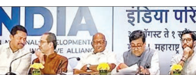
केवल भगवान ही जानता है कि क्या होगा : अब्दुल्ला

मुंबई, नयी दिल्ली। भाजपा और एनडीए को हटाने के लिए बने विपक्षी गठबंधन इंडिया की मुंबई में कल से शुरू होनेवाली तीसरी मीटिंग के लिए ममता बनर्जी, लालू यादव समेत अनेक दिग्गज नेता मुंबई में पहुंच गये हैं। उम्मीद है कि इस मीटिंग में 2024 के लोकसभा चुनाव के मद्देमजर बड़े फैसले हो सकते हैं। सभा की नजर गुरुवार से होने वाली मीटिंग के फैसलों पर है। कांग्रेस की पूर्व अध्यक्ष सोनिया गांधी नौ साल बाद गुरुवार को मुंबई पहुंचेंगी। पांच सितारा होटल में 31 अगस्त से बैठक शुरू होगी। बैठक में लोगो, सीटों के बंटवारे और आपसी खटास दूर कर एकजुट हो एनडीए को हटाने की रणनीति पर चर्चा की उम्मीद