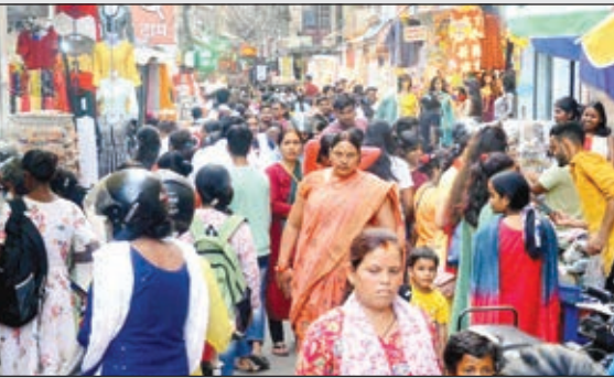
साल रक्षाबंधन का पर्व 30 और 31 अगस्त दो दिन मनाया जा रहा है। 30 अगस्त को रात्रि नौ बजकर एक मिनट के बाद से 31 अगस्त को पूरे दिन