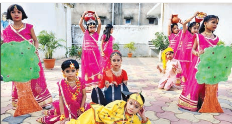
निर्मला कॉन्वेंट हाई स्कूल में भक्ति नाटक में भाग लेते विद्यार्थी।