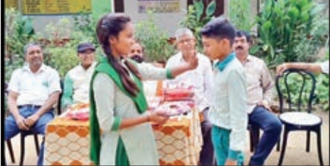
राखी बांधती बहन