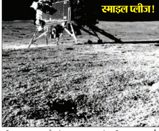
यह चांद की सतह पर और जगह जायेगा और तत्वों की कंपोजिशन और कंसंट्रेशन की जानकारी हासिल करेगा।

बेंगलुरु। चंद्रयान-3 मिशन के रोवर प्रज्ञान ने लैंडर विक्रम की तस्वीर ली है। इसरो ने इस तस्वीर को साझा करते हुए लिखा 'स्माइल प्लीज!' इसरो ने बताया कि रोवर पर लगे नेविगेशन कैमरा ने यह तस्वीर ली है। इस खास कैमरे को लैंडर 'फॉर इलेक्ट्रो ऑप्टिक्स सिस्टम्स' द्वारा विकसित किया गया है। इसरो ने बताया कि रोवर प्रज्ञान ने 30 अगस्त को भारतीय समयानुसार सुबह 7.35 बजे यह तस्वीर खींची।