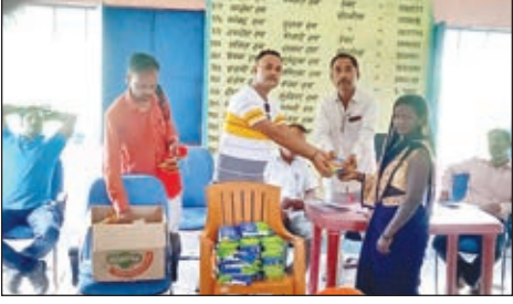
राखी व मिठाई वितरण करते