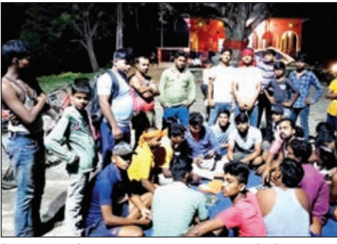
देर संस्था मोरिडीहा दुर्गा मंदिर परिसर में मोरिडीहा पंचायत के युवा

गोड्डा। ठाकुर गंगटी (गोड्डा) बौते वर्षों की तरह इस वर्ष भी ठाकुर गंगटी प्रखंड क्षेत्र के प्रचलित मोरिडीहा गांव में ग्रामीण युवा शक्ति संघ के नवयुवकों द्वारा आस्था, विश्वास, भक्ति, भावना के साथ प्रतिमा स्थापित कर गणपति बप्पा की वार्षिक विशेष पूजा सामूहिक रूप से करने की योजना बनाई जा रही है। इस संबंध में सोमवार की