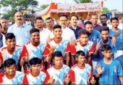
खिलाड़ियों के साथ अतिथि।

लोहरदगा। सदर प्रखंड के अंतर्गत नेशनल फुटबॉल क्लब अरकोसा नवा टोली के तत्वाधान में आयोजित तीन दिवसीय फुटबॉल टूर्नामेंट का समापन समारोह का फाइनल मैच जिओ मैक्स क्लब बनाम और अरकोसा क्लब के बीच खेला गया। जिसमें जिओ मैक्स 1--0 से चैंपियन हुआ। इस समापन समारोह के मुख्य अतिथि झारखंड प्रदेश कांग्रेस कमेटी के पूर्व प्रदेश अध्यक्ष पूर्व विधायक सह लोहरदगा जिला फुटबॉल एसोसिएशन