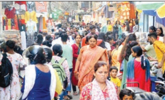
साल रक्षाबंधन का पर्व 30 और 31 अगस्त दो दिन मनाया जा रहा है। 30 अगस्त को रात्रि नौ बजकर एक मिनट के बाद से 31 अगस्त को पूरे दिन