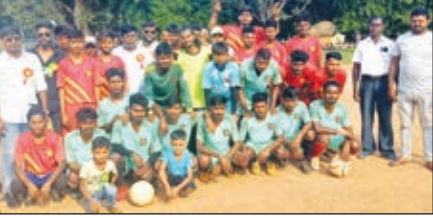
विजेता टीम के साथ अतिथि।

भंडरा। प्रखंड के भीटा मैदान में युवा जागृति क्लब द्वारा आयोजित त्रिविधिय फुटबॉल टूर्नामेंट मैच का भव्य आयोजन किया गया। मैच में कुल 32 टीम भाग लेकर उत्कृष्ट खेल का प्रदर्शन की और दर्शकों की खूब तालियां बटोरी। मौके पर मुख्य अतिथि झारखंड मुक्ति मोर्चा के जिला सचिव अनिल उरांव, विशिष्ट अतिथि के रूप में भंडरा ज्ञामुमो के प्रखंड