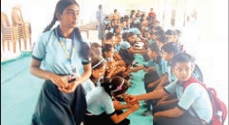
राखी बांधती बहने