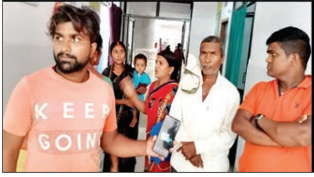
हंगामा करते परिजन