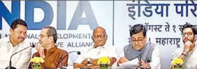
केवल भगवान ही जानता है कि क्या होगा : अब्दुल्ला

मुंबई, नयी दिल्ली। भाजपा और एनडीए को हटाने के लिए बने विपक्षी गठबंधन इंडिया की मुंबई में कल से शुरू होनेवाली तीसरी मीटिंग के लिए ममता बनर्जी, लालू यादव समेत अनेक दिग्गज नेता मुंबई में पहुंच गये हैं। उम्मीद है कि इस मीटिंग में 2024 के लोकसभा चुनाव के मद्देमजर बड़े फैसले हो सकते हैं। सभा की नजर गुरुवार से होने वाली मीटिंग के फैसलों पर है। कांग्रेस की पूर्व अध्यक्ष सोनिया गांधी नौ साल बाद गुरुवार को मुंबई पहुंचेंगी। पांच सितारा होटल में 31 अगस्त से बैठक शुरू होगी। बैठक में लोगो, सीटों के बंटवारे और आपसी खटास दूर कर एकजुट हो एनडीए को हटाने की रणनीति पर चर्चा की उम्मीद