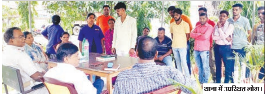
थाना में उपस्थित लोग।

चंदवा। प्रखंड के सेरक पंचायत स्थित श्री श्री 108 ठाकुर जी मंदिर की जमीन को लेकर मंदिर समिति व कुछ लोगों के बीच जमकर विवाद हुआ। मंगलवार की सुबह मंदिर समिति के लोगों के द्वारा मंदिर की जमीन पर कुछ कार्य किया जा रहा था, इसी बीच एक पक्ष के लोग वहां पहुंच गए व कार्य को बाधित कर दिया। जिसके बाद विवाद बढ़ गया व दोनों पक्ष अपने सामने आ गए। सूचना के बाद चंदवा थाना से