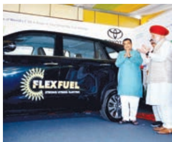
नयी दिल्ली में इनोवा कार लांच करते केंद्रीय मंत्री नितिन गडकरी व अन्य।

सड़क परिवहन और राजमार्ग मंत्री ने कहा कि विनिर्माण और सेवा क्षेत्रों के उच्च योगदान की तुलना में भारत के सकल घरेलू उत्पाद (जीडीपी) में कृषि और संबद्ध क्षेत्र का योगदान केवल 12 प्रतिशत है, जबकि 65 प्रतिशत आबादी कृषि पर निर्भर है।