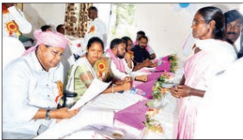
ग्रामीणों की समस्या सुनते मंत्री डॉ रामेश्वर उरांव।

कुड़ु। प्रखंड सह अंचल कार्यालय में कल्याण विभाग द्वारा आयोजित अनुसूचित जनजाति, जाति, अल्पसंख्यक एवं पिछड़ा वर्ग कल्याण विभाग द्वारा स्वीकृत योजना सरना, मसना, अल्पसंख्यक, ईसाई, मुस्लिम कब्रिस्तान धेराबंदी, जनाजा सेड एवं आधारभूत संरचना निर्माण का शिलान्यास वित्त मंत्री डॉ रामेश्वर उरांव द्वारा किया गया। कार्यक्रम की शुरुआत लाभुक समिति के अध्यक्ष, सचिवों को गमछ