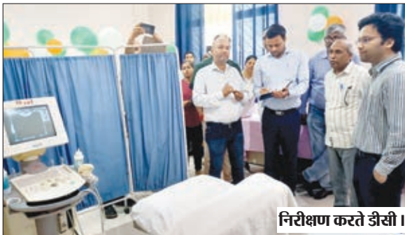
निरीक्षण करते डीसी।

लातेहार। उपायुक्त हिमांशु मोहन के द्वारा मंगलवार को सदर अस्पताल का औचक निरीक्षण किया गया। इस दौरान उपायुक्त द्वारा आईसीयू, ओपीडी, एसएनसीयू, प्रसव वार्ड, एमटीसी, डायलिसिस, जांच केंद्र, जिरियाट्रिक वार्ड, दवा स्टॉक के साथ विभिन्न वार्डों का निरीक्षण कर आवश्यक दिशा निर्देश दिया गया। इस दौरान उपायुक्त ने अस्पताल में भर्ती मरीजों को उपलब्ध करायी जा रही स्वास्थ्य सुविधाओं का जांचा लिया। निरीक्षण के क्रम में उपायुक्त ने सिविल सर्जन को स्पष्ट निर्देश दिया कि स्वास्थ्य सुविधा में किसी प्रकार की लापरवाही नहीं हो। उपायुक्त ने सदर अस्पताल में साफ सफाई पर विशेष ध्यान देने का निर्देश दिया। उन्होंने चिकित्सकों को