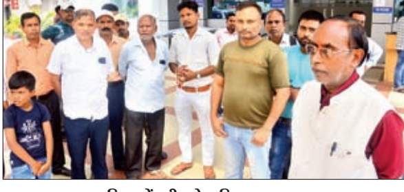
पायस अस्पताल परिसर में मरीज के परिजन।

जानकारी मिलते ही कई वकील और झारखंड हाई कोर्ट के कई बड़े पदाधिकारी अस्पताल पहुंचे और विरोध जताया। बात धीरे-धीरे बढ़ती चली गई और अस्पताल प्रबंधन एवं वकीलों के बीच जमकर बहस होने लगी। अस्पताल में मौजूद डॉक्टरों ने कहा कि मरीज की स्थिति काफी गंभीर है। उन्हें ऑक्सीजन सपोर्ट पर रखा गया है। जिस पर वकीलों ने कहा कि यदि मरीज की स्थिति गंभीर है तो उन्हें वह दूसरे अस्पताल ले जाएंगे लेकिन उससे पहले उन्हें रेफर कर दिया जाए। रेफर करने की बात पर डॉक्टर ने साफ मना कर दिया। डॉक्टरों ने कहा कि मरीज को रेफर करने में रिस्क है, परिजन रेफर कर