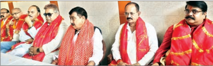
महानगर श्री दुर्गा पूजा समिति की वार्षिक बैठक सह आम सभा में भाग लेते लोग।