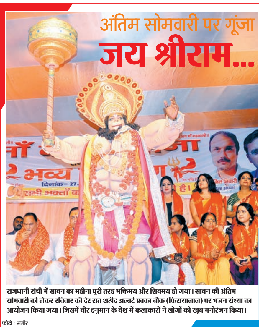
राजधानी रांची में सावन का महीना पूरी तरह भक्तिमय और शिवमय हो गया। सावन की अंतिम सोमवारी को लेकर रविवार की देर रात शहीद अल्बर्ट एक्का चौक (फिरायालाल) पर भजन संध्या का आयोजन किया गया। जिसमें वीर हनुमान के वेश में कलाकारों ने लोगों को खूब मनोरंजन किया।

घोना (बिक्री) : 55,500 रु./10 ग्राम चांदी : 76,000 रु./पति किलो