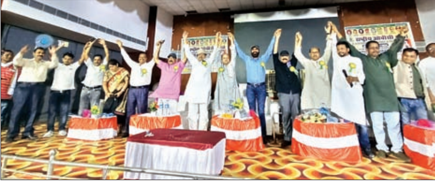
राष्ट्रीय ओबीसी मोर्चा गोड्डा की ओर से आयोजित एकदिवसीय सेमिनार में एकजुटता प्रदर्शित करते लोग।