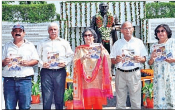
सर दोराब जी पर प्रकाशित कॉमिक का विमोचन करते अतिथिगण।