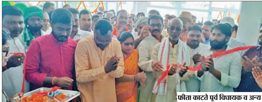
फौता काटते पूर्व विधायक व अन्य।