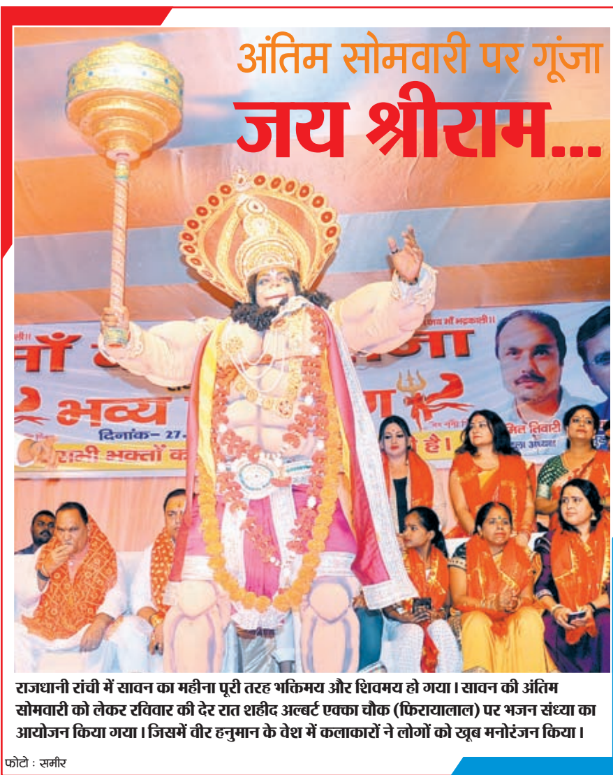
राजधानी रांची में सावन का महीना पूरी तरह भक्तिमय और शिवमय हो गया। सावन की अंतिम सोमवारी को लेकर रविवार की देर रात शहीद अल्वर्ट एक्का चौक (फिरायालाल) पर भजन संध्या का आयोजन किया गया। जिसमें वीर हनुमान के वेश में कलाकारों ने लोगों को खूब मनोरंजन किया।

दौरान मसियातु गांव की एक झलक दिखाये जाने को लेकर ही ग्रामीण काफी खुश दिखे। (शेष पेज 11 पर)