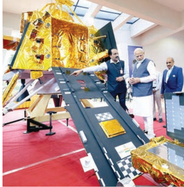
बेंगलुरु में शनिवार को आदित्य एल1 को देखते प्रधानमंत्री नरेंद्र मोदी।

जानकारी प्रदान कर सकते हैं। उपग्रह को दो सप्ताह पहले आंध्र प्रदेश के श्रीहरिकोटा स्थित इसरो के अंतरिक्ष केंद्र पर लाया गया है। इसरो के एक अधिकारी ने कहा कि प्रक्षेपण दो सितंबर को होने की अधिक संभावना। अंतरिक्ष यान को सूर्य-पृथ्वी लाग्रेंज बिंदु की एल1 हेलो कक्षा के पास स्थापित करने की योजना है। इसरो ने कहा कि एल1 बिंदु के आसपास हेलो कक्षा में स्थापित उपग्रह को सूर्य को बिना किसी ग्रहण के लगातार देखने का बड़ा फायदा मिल सकता है। इसने कहा है कि इससे वास्तविक समय में सौर गतिविधियों और अंतरिक्ष मौसम पर इसके प्रभाव का पता लगाया जा सकेगा।