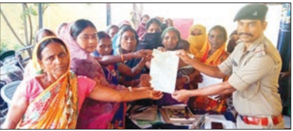
थाना प्रभारी को आवेदन देतीं भुवतभोगी महिलाएं।