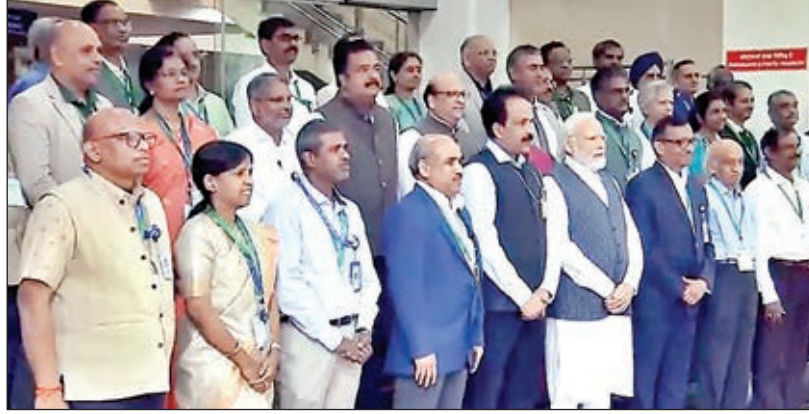
चंद्रयान-3 मिशन की सफलता के बाद शनिवार को इसरो के वैज्ञानिकों की टीम के साथ पीएम नरेंद्र मोदी।

बंगलुरु। पीएम मोदी चंद्रयान-3 मिशन की सफलता के बाद भारतीय अंतरिक्ष अनुसंधान संगठन (इसरो) के वैज्ञानिकों से मिलने के लिए यूनान की राजधानी एथेंस से शनिवार को सीधे बंगलुरु पहुंचे। उन्होंने घोषणा की है कि चंद्रयान-3 लैंडर चंद्रमा की सतह पर जिस स्थान पर उतरा है, उसका नाम शिव-शक्ति पॉइंट रखा जायेगा, जो कल्याण एवं ताकत का मेल है। वहीं चंद्रमा की सतह पर जिस स्थान पर चंद्रयान-2 ने 2019