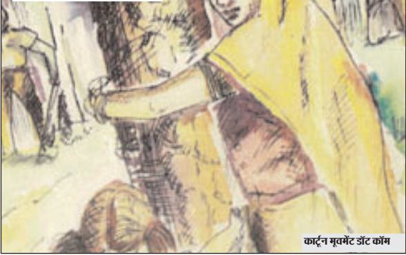
कार्टून मुव्हेट डेट कॉम