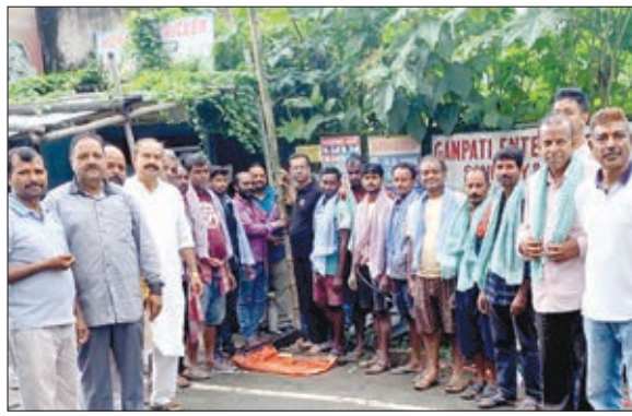
भूमि पूजन करते दुर्गा पूजा समिति गीतांजलि क्लब, मोरहाबादी के लोग।