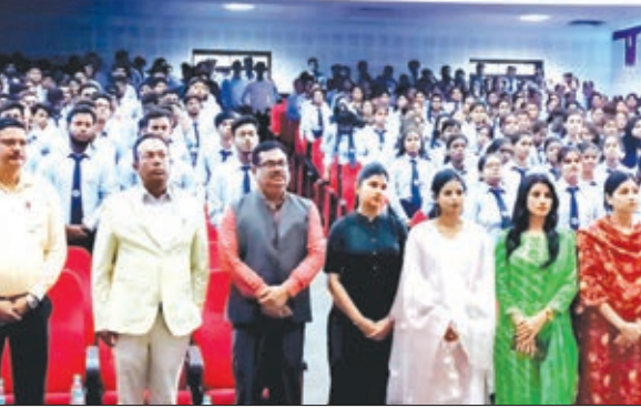
इंडवशन कार्यक्रम में शामिल विद्यार्थी।