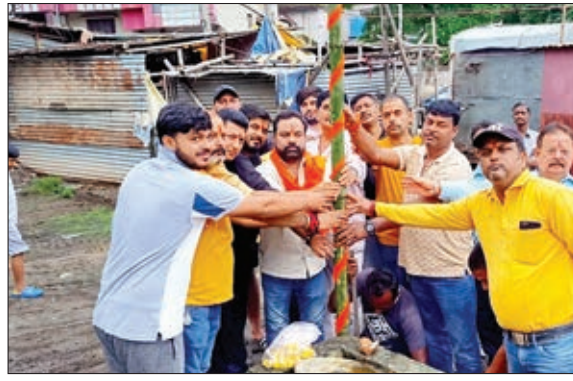
भूमि पूजन में भाग लेते स्वर्ण ज्यंती क्लब बरियातू के सदस्य।