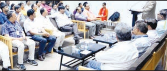
सरला बिरला विवि के कार्यक्रम में भाग लेते लोग।