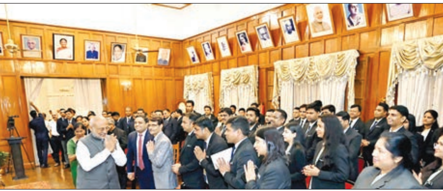
प्रशिक्षु अधिकारियों से मिलते राज्यपाल सीपी राधाकृष्णन।

रांची। राज्यपाल सीपी राधाकृष्णन ने गुरुवार को राजभवन में प्रशिक्षु काराधीक्षकों, प्रोबेशन ऑफिसर्स एवं सहायक लोक अभियोजकों से संवाद करते हुए कहा कि समाज को आपसे काफी अपेक्षाएं हैं। उम्मीद है कि आप समर्पित होकर अपने उत्तरदायित्व का निर्वहन करेंगे। आपने जिस राह का चयन किया है, इस राह पर चलकर आपको एक अच्छे समाज की रचना में अपना सक्रिय योगदान देना है एवं समाज की बेहतरी के लिए लगातार काम करना है। जैसे-जैसे समाज में विकास कार्य आगे बढ़ता है, वैसे-वैसे लोगों की अपेक्षाएं भी बढ़ती हैं। सफलता की परिभाषा यह नहीं है कि आप अपनी भौतिक आवश्यकताओं को कितना पूरा