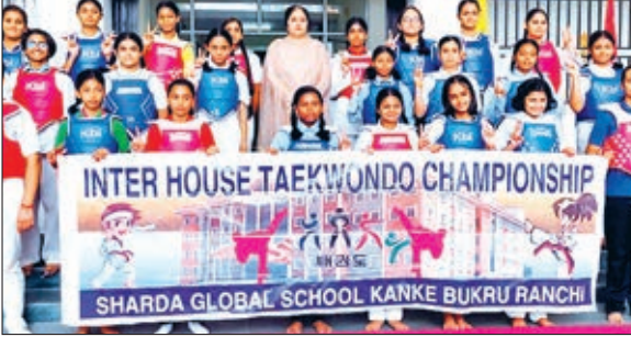
इंटर हाउस ताइक्वांडो प्रतियोगिता में भाग लेने वाले बच्चे।

रांची। शारदा ग्लोबल स्कूल में दो दिवसीय इंटर हाउस ताइक्वांडो प्रतियोगिता आयोजित हुई। इसमें कक्षा षष्ठम से कक्षा नवम तक के छात्रों ने हिस्सा लिया। इस प्रतियोगिता में कुल 80 पदक (20 स्वर्ण, 20 रजत एवं 40 कांस्य पदक) के लिए छात्रों ने अपना उत्कृष्ट प्रदर्शन दिखा पदक हासिल किये। इस प्रतियोगिता में एक्यूबरेट