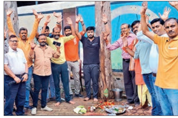
भूमि पूजन करते ज्योति संगम श्री दुर्गा पूजा समिति के सदस्य।

हाउसिंग कॉलोनी चौक के सदस्यों ने भी अपनी तैयारी को लेकर भूमि पूजन किया। इस भूमि पूजन के साथ माता रानी के आगमन की