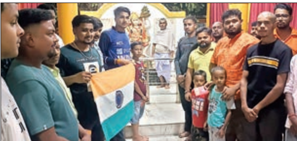
मंदिर में पूजा-अर्चना करने पहुंचे लोग।