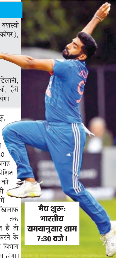
मैच शुरू: भारतीय समयानुसार थाम 7:30 बजे।

मिल गया है। रिकू, यशस्वी जायसवाल और रतुराज गायकवाड़ जैसे खिलाड़ी भारतीय टी20 टीम में अपनी जगह मजबूत करने की कोशिश करेंगे क्योंकि भारत को इस प्रारूप में अपनी अमली सीरीज नवंबर में ऑस्ट्रेलिया के खिलाफ खेलनी है। जहां तक आयरलैंड का सवाल है तो भारत पर जीत दर्ज करने के लिए उसे खोल के हर विभाग में अच्छे प्रदर्शन करना होगा।