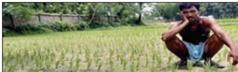
खेत में पड़ी दरार को देख विचिंत किसान और तालाब का हाल।

पानी की कमी से इसका असर नहीं दिख रहा है। इससे खेतों में खरपतवार तेजी से बढ़ रहे हैं। धान के पौधों की बढ़त रुक गई है। इससे किसानों में त्राशा है। उन्हें खेतों में खर्च की गई पूंजी डूबती नजर आ रही है। किसानों को साहूकारों, बैंकों से लिए कर्ज की चिंता सता रही है। ग्राम