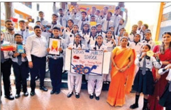
प्रतियोगिता में बनायी गयी राखी को दिखाते विद्यार्थी।