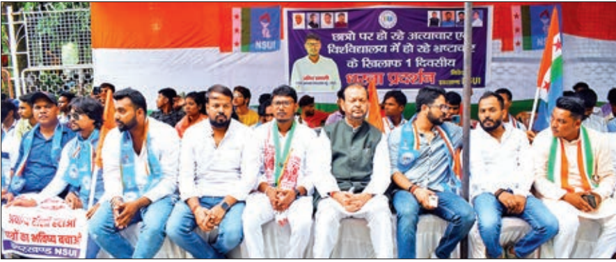
राजभवन के समक्ष मंगलवार को धरना देते एनएसयूआइ के सदस्य। साथ हैं पूर्व केंद्रीय मंत्री सुबोधकांत खल्ला।

उन्होंने कहा कि विश्वविद्यालय प्रशासन जल्द से जल्द पूरे राज्य में छात्र संघ चुनाव कराने का काम करे। वहीं, झारखंड के सभी डिग्री कॉलेज में पुनः इंटरमीडिएट की