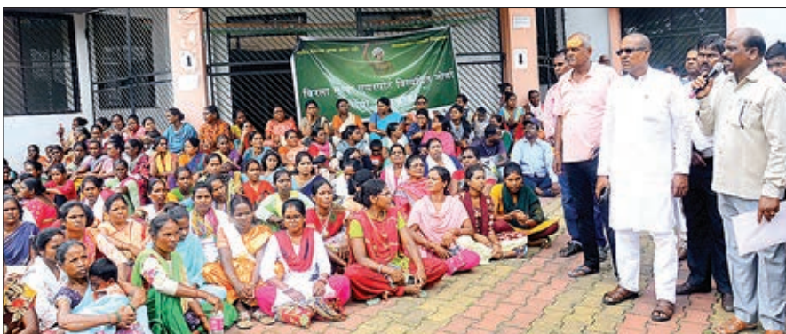
अरगोड़ा अंचल कार्यालय का घेराव करते ग्रामीण।

घेराव प्रदर्शन के दौरान कार्यालय का कामकाज ठप रहा कार्यक्रम के माध्यम से सात सूत्री मांग पत्र अंचल निरीक्षक को सौंपा गया। जिस पर अरगोड़ा सीओ व ग्रामीणों के 10 सदस्य प्रतिनिधि मंडल के साथ 24 अगस्त को सुबह 11:00 बजे वार्ता होगी। 7 सूत्री मांगों में 1-सेना द्वारा रैयती जमीन