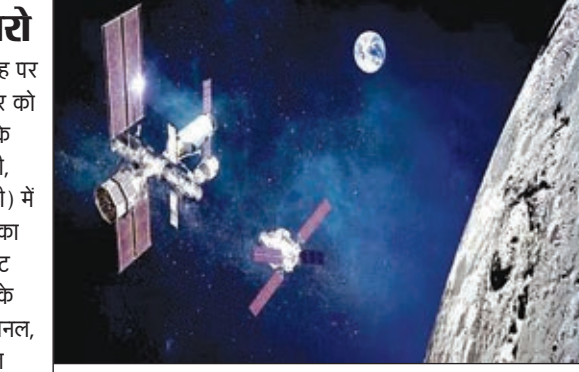
चंद्रयान ने भेजी चांद के साथ-साथ पृथ्वी की खूबसूरत तस्वीर ।

बुधवार को देश के लिए आखिरी के 20 मिनट बड़ी मुश्किल से बीतेगे जब