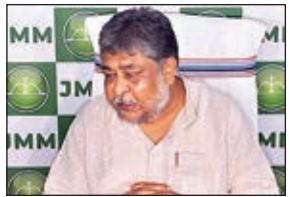
चुनाव के पहले उसे अपने पाले में लाना है, उसके खिलाफ जांच एजेंसियां लगा दी जाती हैं।

प्रोजेक्ट, केंद्रीय मंत्री स्मृति इरानी का विभाग, स्वास्थ्य मंत्रालय, वित्त विभाग और रेल मंत्रालय में करोड़ों रुपये की अनियमितता का खुलासा उनके ही गुजरत कैंडर के अधिकारी ने कैग रिपोर्ट में किया है मगर केंद्रीय जांच एजेंसियों ने चुप्पी साध रखी है। इससे यह साबित होता है कि केंद्रीय जांच एजेंसियां किसके इशारे पर काम करती हैं। जहां भी बनी सरकार को गिराना है या फिर