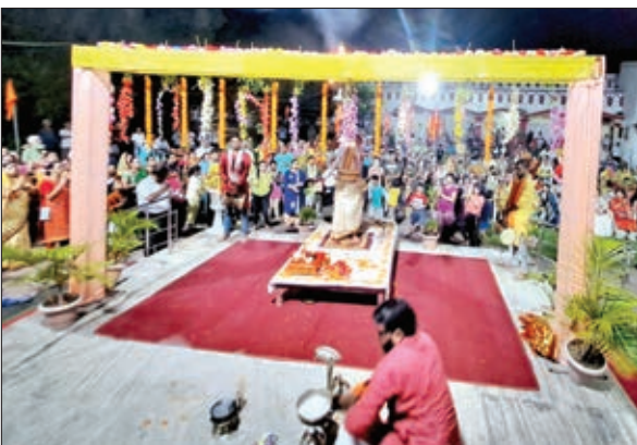
अशोक नगर मंदिर में महाआरती में भाग लेते लोग।