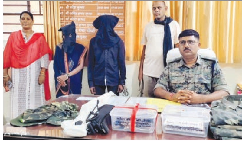
प्रेस वार्ता कर जानकारी देते पुलिस पदाधिकारी