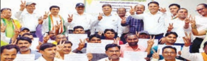
अधिकारी व अन्य