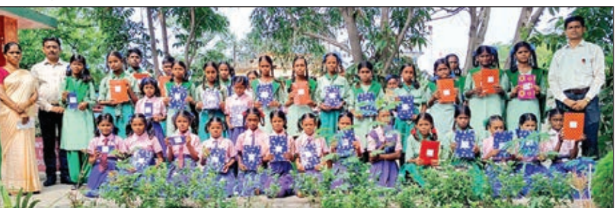
उमवि महावीर नगर उपर टोला स्कूल में सम्मानित हुए विद्यार्थी।