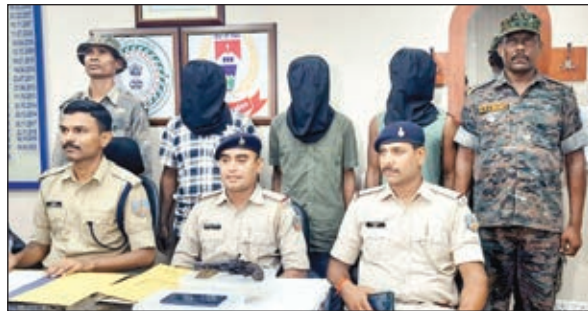
तमाड़ थाना में पुलिस की गिरफ्त में लूटकांड के आरोपी।