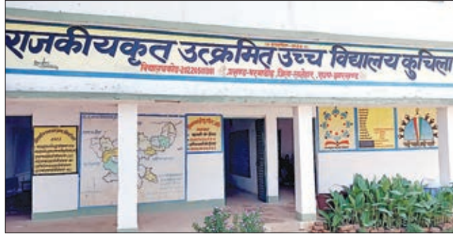
सरकारी उपेक्षा का शिकार हाई स्कूल कुचिला

के लिए यहां एक भी शिक्षक नहीं है। विद्यालय में शिक्षकों की संख्या महज पांच है। जिनमें तीन पारा शिक्षक हैं। इसके अलावा एक आईसीटी इंस्ट्रक्टर है। सरकारी उपेक्षा का दंश झेल रहे इस विद्यालय के बच्चों की पढ़ाई राम भरोसे चल रही है। हाई स्कूल के लिए