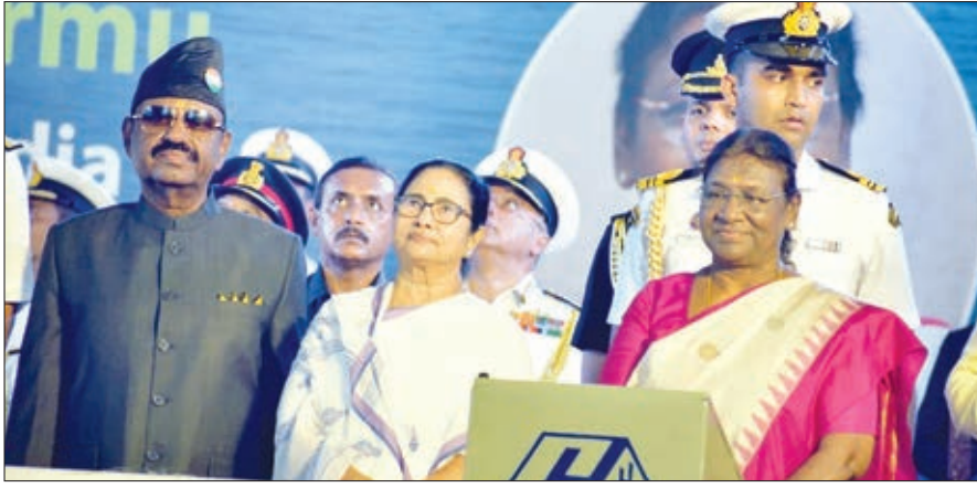
कोलकाता में 'विंध्यागिरी' का जलावतरण करती राष्ट्रपति द्रौपदी मुर्मू, साथ हैं प. बंगाल की सीएम ममता बनर्जी।

राष्ट्रपति ने आगे कहा कि प्रोजेक्ट 17ए, जिसका विंध्यागिरी एक हिस्सा है, आत्मनिर्भरता और तकनीकी उन्नति के प्रति हमारी प्रतिबद्धता को दर्शाता है। यह परियोजना अत्याधुनिक प्रौद्योगिकी विकसित करने के लिए स्वदेशी नवाचार को प्रदर्शित करती है। उन्होंने कहा कि मुझे बताया गया है कि इस श्रृंखला के मल्टी-मिशन फ्रिगेट हमारे समुद्री हितों के लिए सभी प्रकार के खतरों से निपटने में