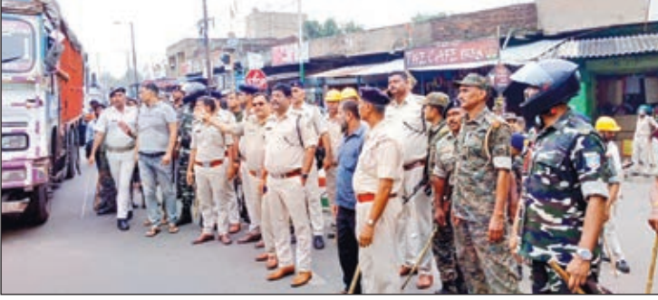
धनबाद में पत्थरबाजी के बाद मामले को शांत करने पहुंची पुलिस।