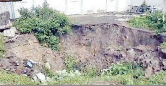
जोगता जामा मस्जिद के निकट घंसी हुई जमीन।

सिजुआ/जोगता। कोईलांचल में भू धंसान की घटना आम बात हो गई है। लोग जब रात में अपने परिवार के साथ सोते हैं तो अगले दिन का सूरज वह देख पाएंगे या नहीं यह भी पता नहीं होता है। धनबाद जिले के बीसीसीएल क्षेत्र संख्या 5 के अंतर्गत पड़ने वाला जोगता थाना क्षेत्र का 22/12 बस्ती जहां अधिकांश समुदाय मुस्लिम वर्ग से आते हैं उस जगह पर बार-बार भू-धंसान की घटना हो रही है। पिछले वर्ष भी 2212 में स्थित जामा मस्जिद भू-धंसान की चपेट