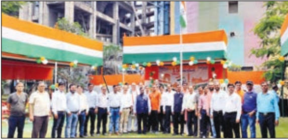
कारखाना परिसर में स्वतंत्रता दिवस मनाते अधिकारी और कर्मचारी।

बोकारो। भारत के प्रमुख एकीकृत स्टील निर्माता वेदांता ईएसएल ने अपनी प्रगति, सशक्तिकरण और समुदाय पर सकारात्मक प्रभाव की पुनरावृत्ति करते हुए स्वतंत्रता दिवस के उत्सव में वेदांता ईएसएल रिस्कल स्कूल, वेदांता ईएसएल आर्चरी अकादमी, वेदांता ईएसएल एक्सेल 30 सेंटर, वेदांता आस विद्यालय और प्राथमिक स्वास्थ्य केंद्र, धनडाबर और 150 नंद घर को शामिल किया। रिस्कल स्कूल और आर्चरी अकादमी के छात्र ने विभिन्न देशभक्ति गीत, नृत्य, भाषण, शायरी और नाटक प्रस्तुत किए। मौके पर उपस्थित दर्जनों जन-प्रतिनिधियों ने युवा बच्चों को प्रेरित करने में भी महत्वपूर्ण भूमिका निभाई और उन्हें स्वतंत्र राष्ट्र के रूप में भारत की महत्वपूर्ण उपलब्धियों के बारे में बताया। स्वतंत्रता दिवस का उत्सव प्राथमिक स्वास्थ्य केंद्र, धनडाबर, वेदांता आस विद्यालय सहित 150 नंद घरों में भी मनाया गया। उल्लेखनीय है कि वेदांता ईएसएल राष्ट्र के विकास के लिए तत्पर रहने के साथ ही अपने विभिन्न सीएसएआर पहलुओं के माध्यम से दूसरों को भी ऐसे ही करने का सामर्थ्य प्रदान करता है।