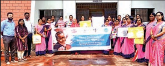
कार्यक्रम में शामिल आंगनवाड़ी सेविकाएं।

ओरमांडी। आंगनवाड़ी में नूढ़े कदम पाठ्यक्रम की गतिविधियों का बेहतर ढंग से संचालन करने को लेकर प्रखंड के आंगनवाड़ी सेविका व सहायिकाओं को विशेष प्रशिक्षण दिया गया। समेकित बाल विकास योजना के तहत प्रखंड मुख्यालय ओरमांडी में आयोजित प्रशिक्षण कार्यक्रम में यूनिसेफ व विक्रमशिला एजुकेशन रिसोर्स सोसाइटी के संयुक्त तत्वावधान में प्रशिक्षण दिया गया। जिसमें विभिन्न प्रकार के घरेलू सामग्रियों के माध्यम से बच्चों के गतिविधियों में बेहतर बदलाव लाने का प्रयास करना है। प्रशिक्षकों