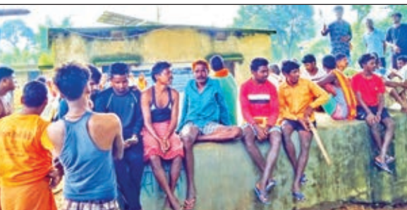
शाहेदा गांव में ग्राम सभा के दौरान बैठक में उपस्थित ग्रामीणी।