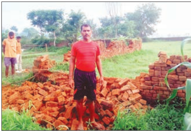
हाथियों के द्वारा किया गया बर्बादी