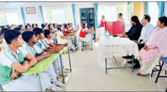
कैरियर काउंसिलिंग में शामिल ऑक्सब्रिज स्कूल के बच्चे।